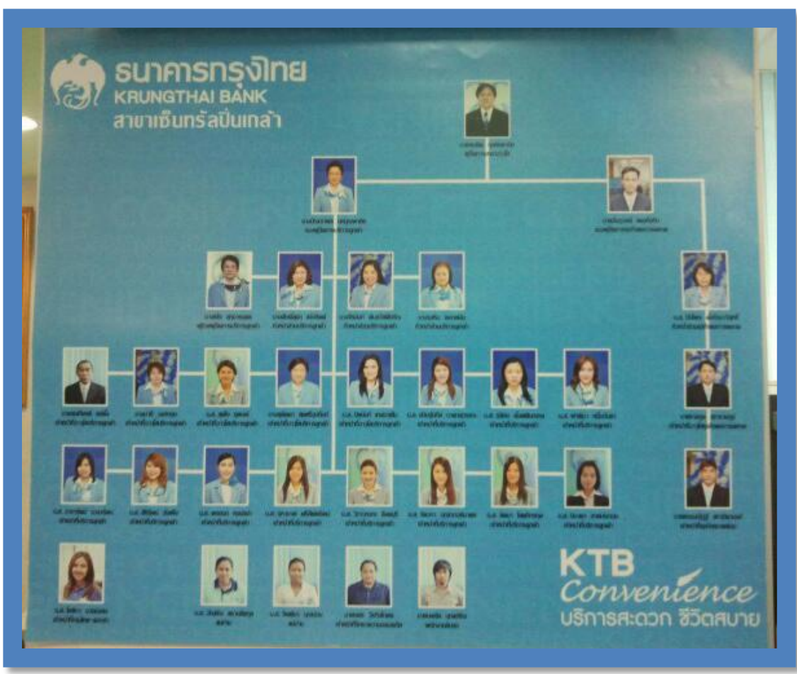
รูปที่ 1.2 รูปแบบการจัดองค์กรธนาคารกรุงไทย สาขาเซนต์ปัลเบ็งเกล้า