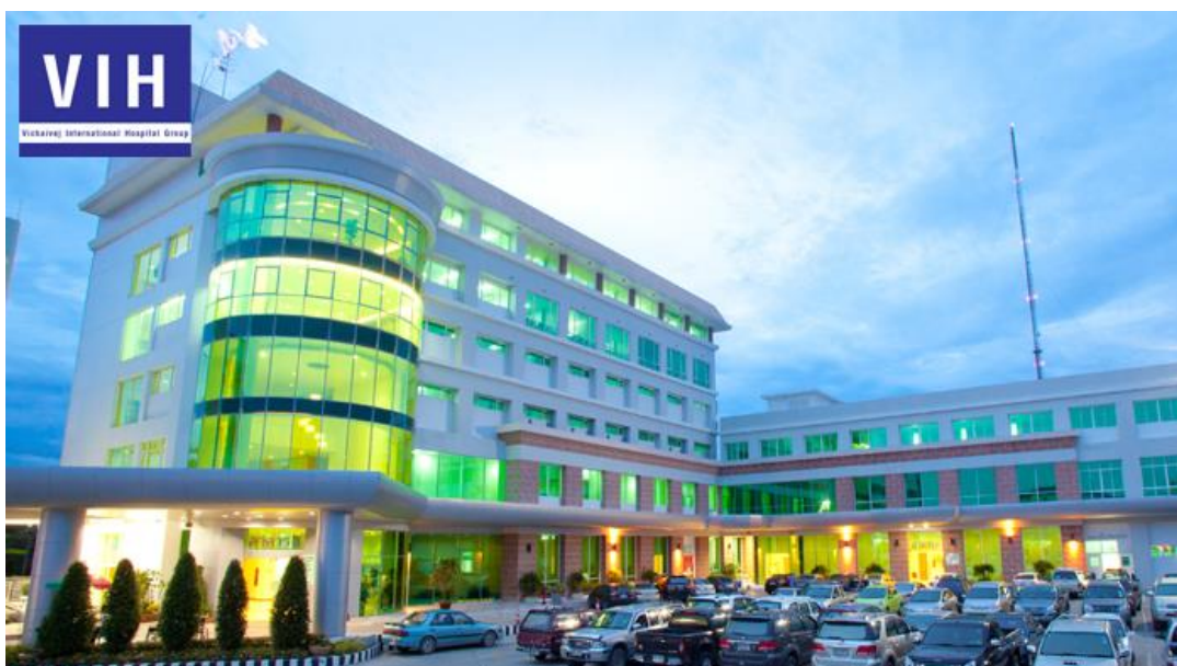
รูปที่ 3.2 ตัวอย่างโรงพยาบาลวิชัยเวช อินเตอร์เนชั่นแนล หนองแขม

โรงพยาบาลวิชัยเวช อินเตอร์เนชั่นแนล หนองแขม เป็นโรงพยาบาลเอกชน ก่อตั้งเมื่อวันที่ 10 มกราคม 2531 บน ถนนเพชรเกษม เขตหนองแขม กรุงเทพมหานคร บนเนื้อที่ 7 ไร่ เป็นโรงพยาบาลขนาด 100 เตียง มีอุปกรณ์ เครื่องมือทางการแพทย์ที่ทันสมัย ครบครัน เปิดให้บริการรักษาผู้ป่วยทั่วไปโดยแพทย์ผู้เชี่ยวชาญทุกสาขา ตลอดจนทีมพยาบาล และทีมบริการที่ดูแลอย่างใกล้ชิด โดยมุ่งเน้นตอบสนองความต้องการของผู้รับบริการ ตามมาตรฐานสากลเป็นหลัก ปี พ.ศ. 2545