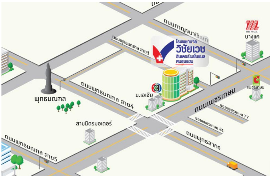
รูปที่ 3.1 แผนที่ตั้งโรงพยาบาลวิชัยเวช อินเตอร์เนชั่นแนล หนองแขม