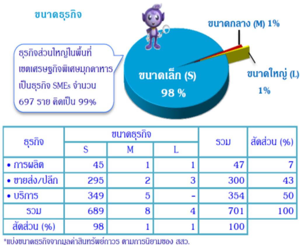
รูปที่ 2.2 ขนาดธุรกิจ

ประเภทธุรกิจ ธุรกิจที่มีจำนวนผู้ประกอบการสูงสุด 5 อันดับแรกได้แก่