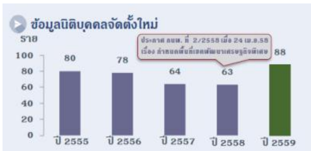
รูปที่ 2.3 ข้อมูลนิติบุคคลจัดตั้งใหม่

จำนวนการจดทะเบียนจัดตั้งนิติบุคคลในพื้นที่เขตพัฒนาเศรษฐกิจพิเศษนครพนมมีแนวโน้มลดลงตั้งแต่ปี 2555 ถึง 2558 ทั้งนี้ในช่วงปี 2558 หลังประกาศกำหนดเขตพัฒนาเศรษฐกิจพิเศษนครพนมยังอยู่ในระหว่างการพัฒนาพื้นที่และการเตรียมความพร้อมในการประกอบธุรกิจของภาคเอกชนโดยการจดทะเบียนนิติบุคคลในปี 2559 มีจำนวน 88 รายเพิ่มขึ้น 25 รายคิดเป็น 40% นอกจากนี้เมื่อพิจารณาในภาพรวมของจังหวัดนครพนมมีนิติบุคคลจัดตั้งทั้งสิ้นจำนวน 231 รายเพิ่มขึ้นจากปีก่อน 86 รายคิดเป็น 59%