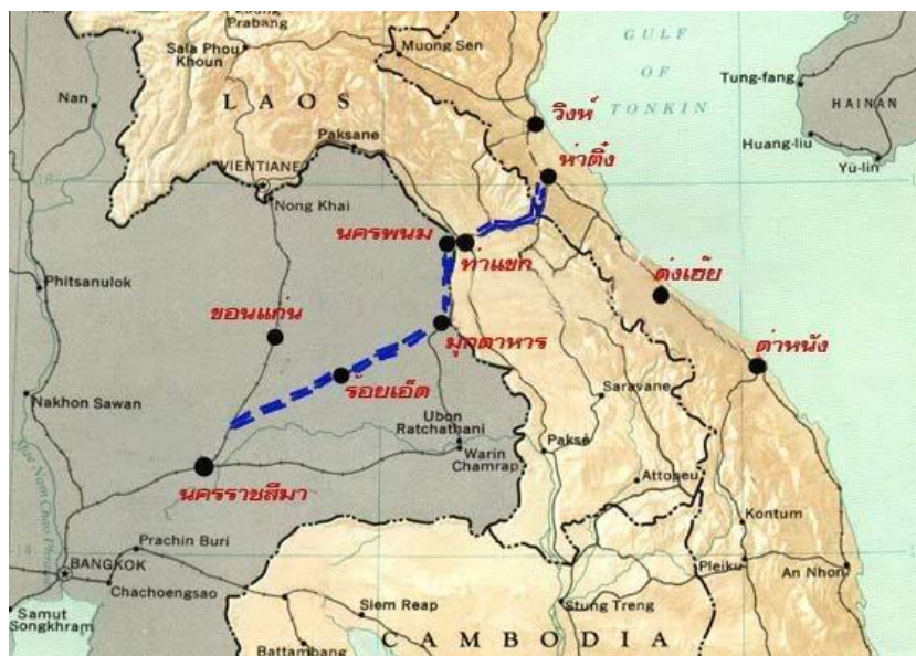
รูปที่ 2.9 เส้นทางรถไฟรางคู่จากอำเภอบ้านไผ่ – จังหวัดนครพนม

ภาพเส้นทางรถไฟรางคู่จากอำเภอบ้านไผ่ – จังหวัดนครพนมสิ้นสุดที่สะพานมิตรภาพ 3 ต่อถึงหาดิงห์