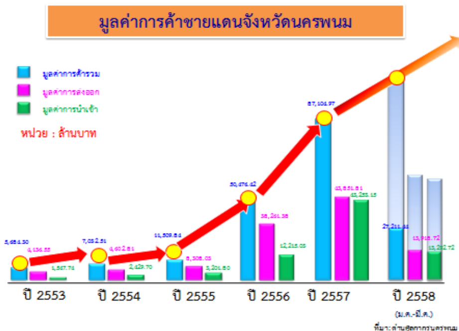
รูปที่ 2.6 มูลค่าการค้าชายแดนจังหวัดนครพนมปีงบประมาณพ.ศ.2553-2558

สินค้านำเข้าที่ผ่านด่านศุลกากรนครพนมประจำปีงบประมาณ 2557 ที่สำคัญดังภาพ ภาพ 10 อันดับรายการสินค้าส่งออก-นำเข้าประจำปีงบประมาณ 2557