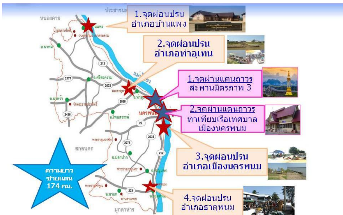
รูปที่ 2.5 แสดงจุดผ่านแดนถาวรและจุดผ่อนปรนจังหวัดนครพนม

ภาพรวมมูลค่าการส่งออกและการนำเข้าของสินค้าต่างๆผ่านด่านศุลกากรนครพนมจังหวัดนครพนมปีงบประมาณ 2557 โดยการนำเข้ามีอัตราเทียบกับปีงบประมาณ 2556 ขยายตัวเพิ่มขึ้นร้อยละ 268.6 ส่วนการส่งออกรวมมีอัตราการขยายตัวร้อยละ 48.5 มูลค่าการค้ารวมทั้งหมดขยายตัวเพิ่มขึ้นร้อยละ 100.6 ดังภาพ