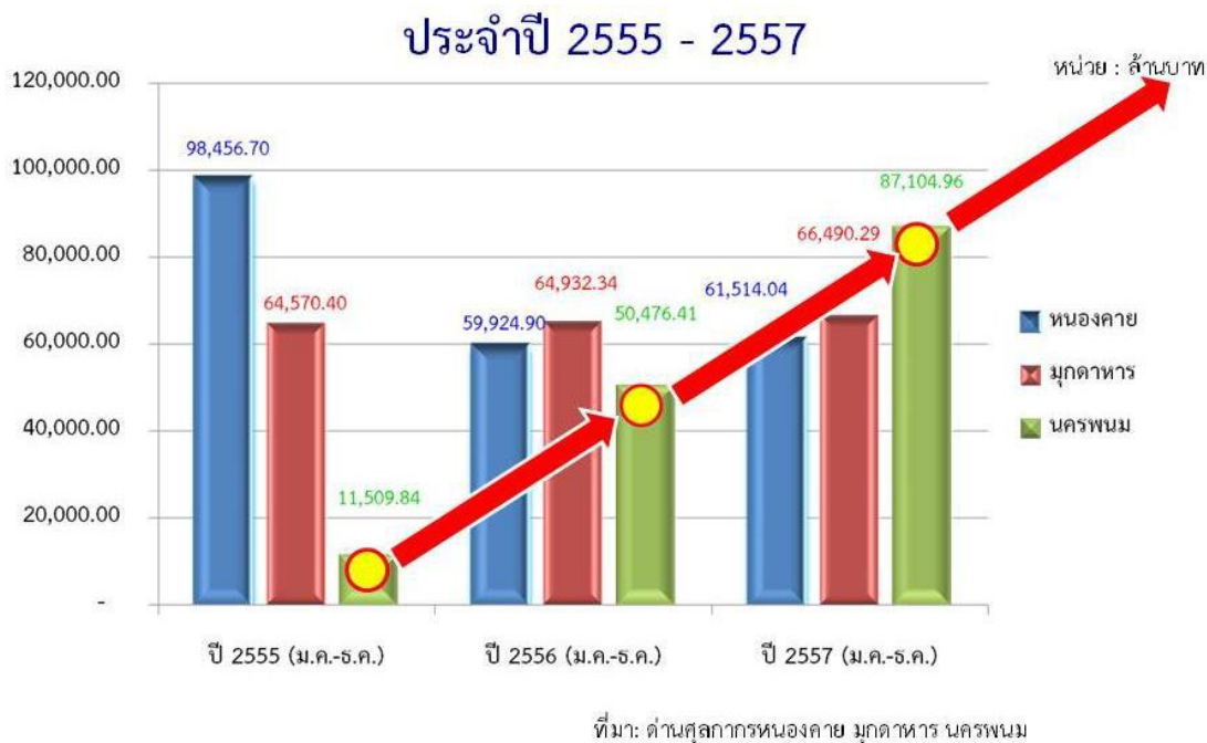
รูปที่ 2.8 แสดงมูลค่าการค้าชายแดนส่งออกนำเข้า

แสดงมูลค่าการค้าชายแดนส่งออกนำเข้าเปรียบเทียบระหว่างค่านองคาย Mukdahan และ นครพนม