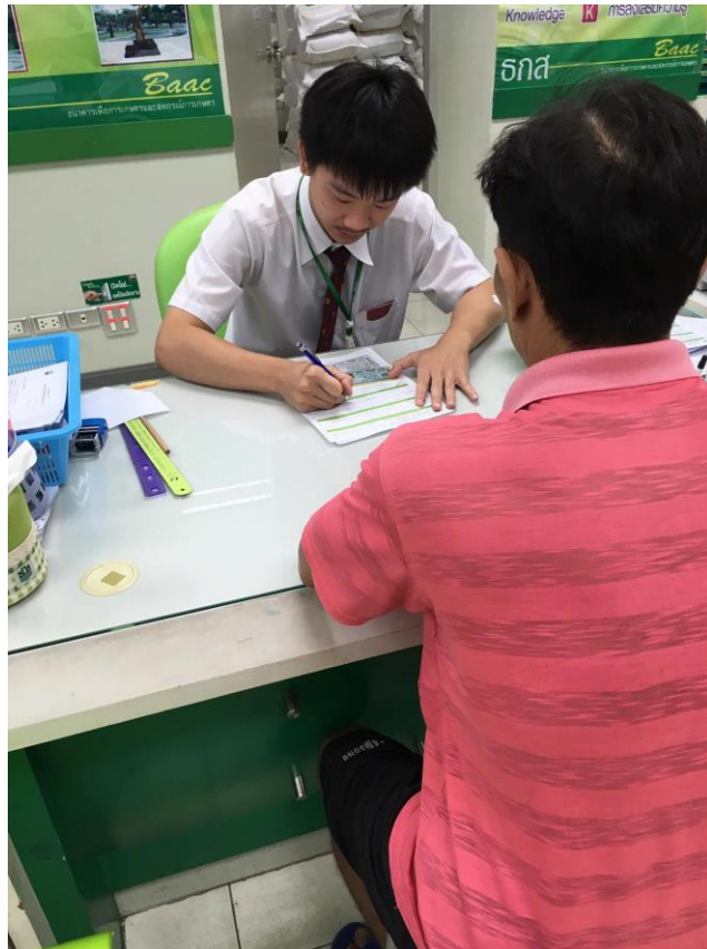
รูปที่ 1.4 บรรยากาศในการทำงาน