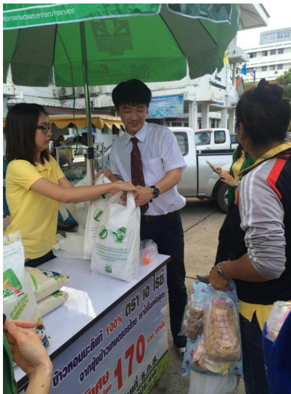
รูปที่ 1.2 บรรยายภาพในการทำงาน