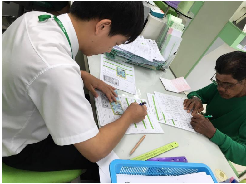
รูปที่ 1.3 บรรยากาศในการทำงาน