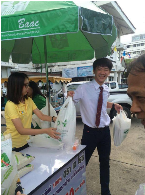
รูปที่ 1.1 บรรยายภาพในการทำงาน