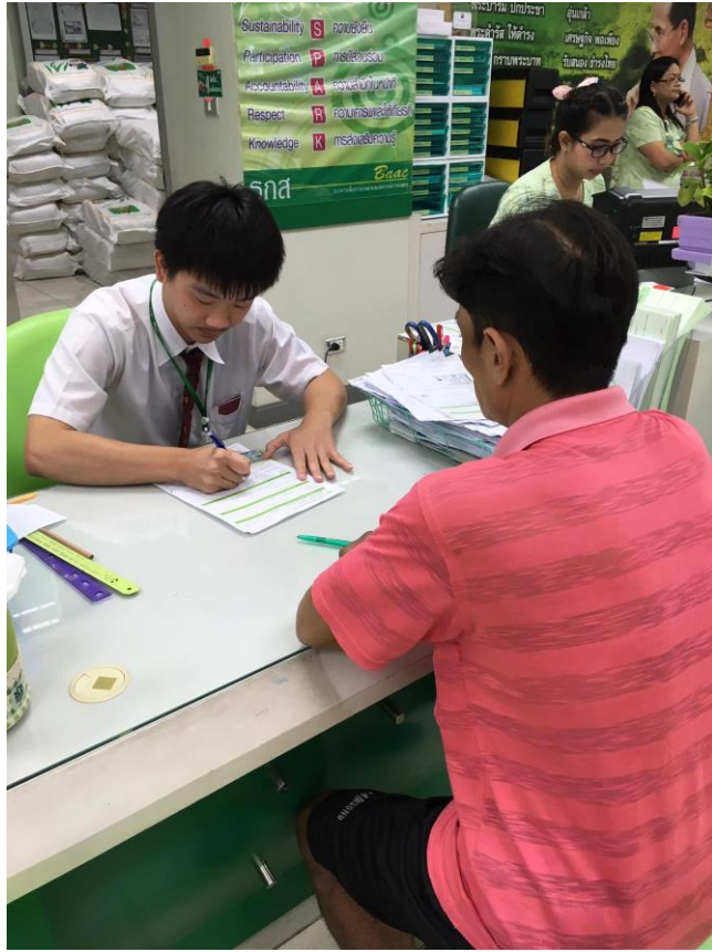
รูปที่ 1.5 บรรยากาศในการทำงาน