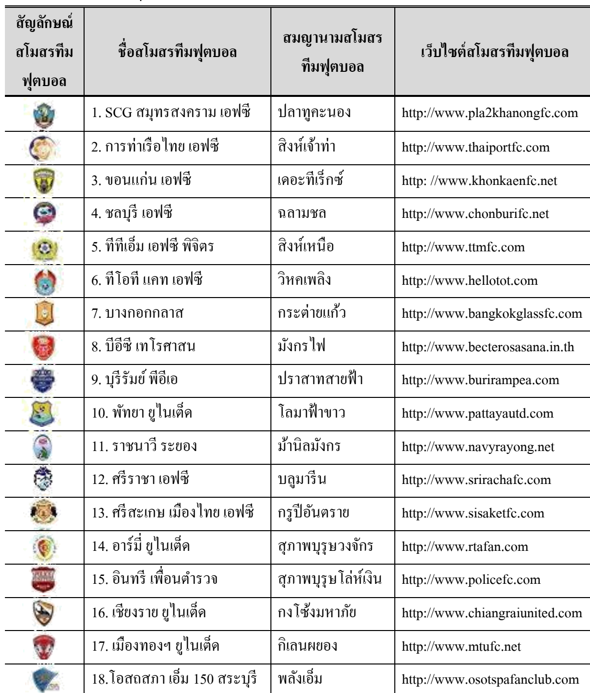
ตารางที่ 1.5 สโมสรทีมฟุตบอลร่วมการแข่งขันไทยพรีเมียร์ลีก พ.ศ. 2554

(ที่มา: สมาคมกีฬาฟุตบอลแห่งประเทศไทย, 2553)