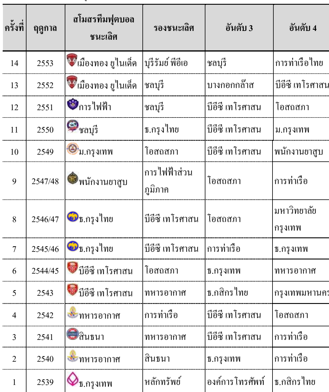
ตารางที่ 1.1 สโมสรทีมฟุตบอลชนะเลิศไทยพรีเมียร์ลีก พ.ศ. 2539-2553

(ที่มา: สมาคมกีฬาฟุตบอลแห่งประเทศไทย, 2553)