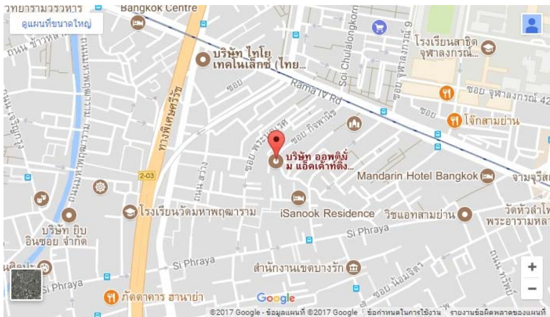
รูปที่ 3.1 แผนที่ตั้งบริษัทออปติ่มแอ็คเค้าท์ติ้ง เซอร์วิสเชส จำกัด