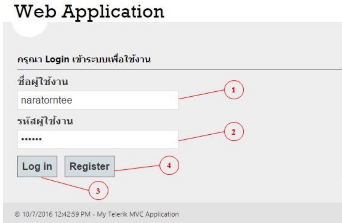
รูปที่ 4.1 กรอกชื่อและรหัสผู้ใช้งาน

เปิดบราวเซอร์ขึ้นมาระบุ 61.90.149.15/COP ที่ช่องแอดเดรส