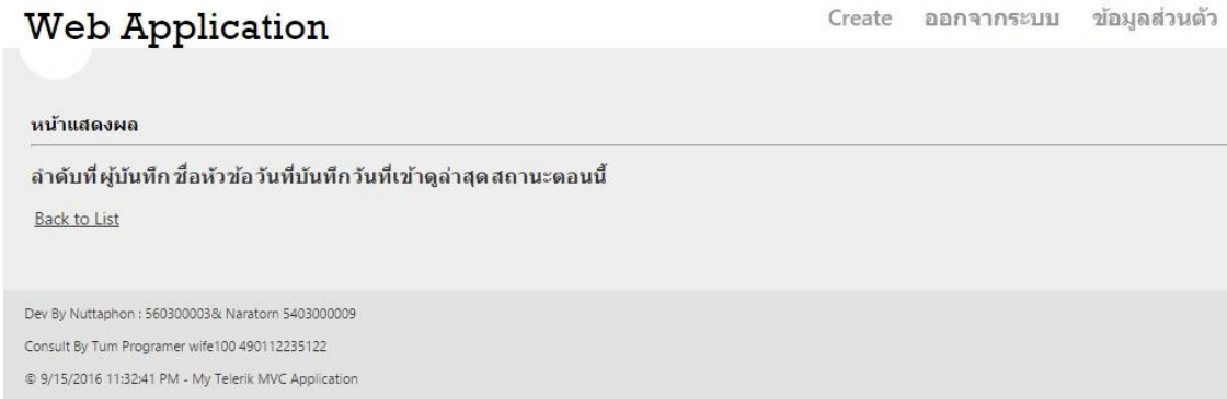
รูปที่ 4.10 แถบเมนูข้อมูลส่วนตัว

จากรูปที่ 4.10 ผู้ใช้งานเลือกดูรายละเอียดข้อมูลส่วนตัวได้ให้ทำการคลิกปุ่ม ข้อมูลส่วนตัว ระบบจะทำการแสดงหน้าจอรูปที่ 4.11