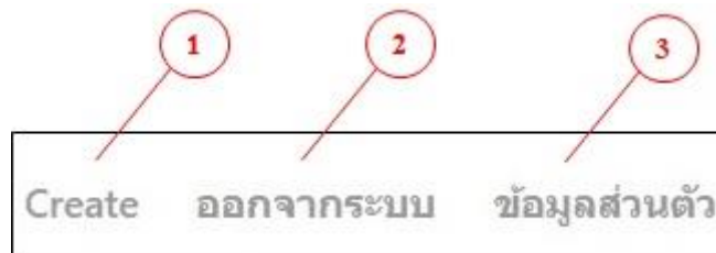
รูปที่ 4.3 เมนูการใช้งานต่างๆ

จากรูปที่ 4.2 เมื่อผู้ใช้งานล็อกอินเข้าระบบ ระบบจะแสดงลำดับที่ ชื่อผู้บันทึก ชื่อหัวข้อ ปัญหา วันที่บันทึก วันที่เข้าดูล่าสุด (วันที่ผู้ใช้งานเข้าระบบล่าสุด) และสถานะ สามารถกดปุ่ม ดู เพื่อเข้าดูรายละเอียดต่างๆ ของปัญหาที่บุคคลภายในทีมได้ทราบถึงปัญหา