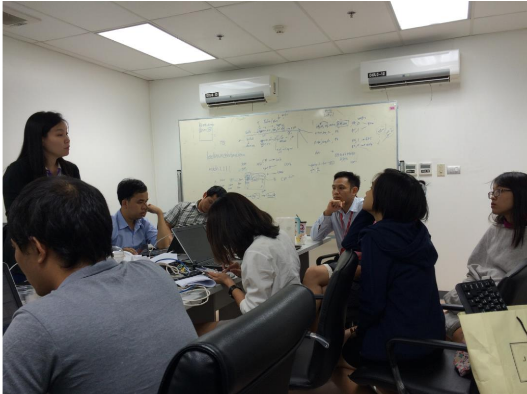
รูปที่ ก.1 สถานที่ทำงานประจำ