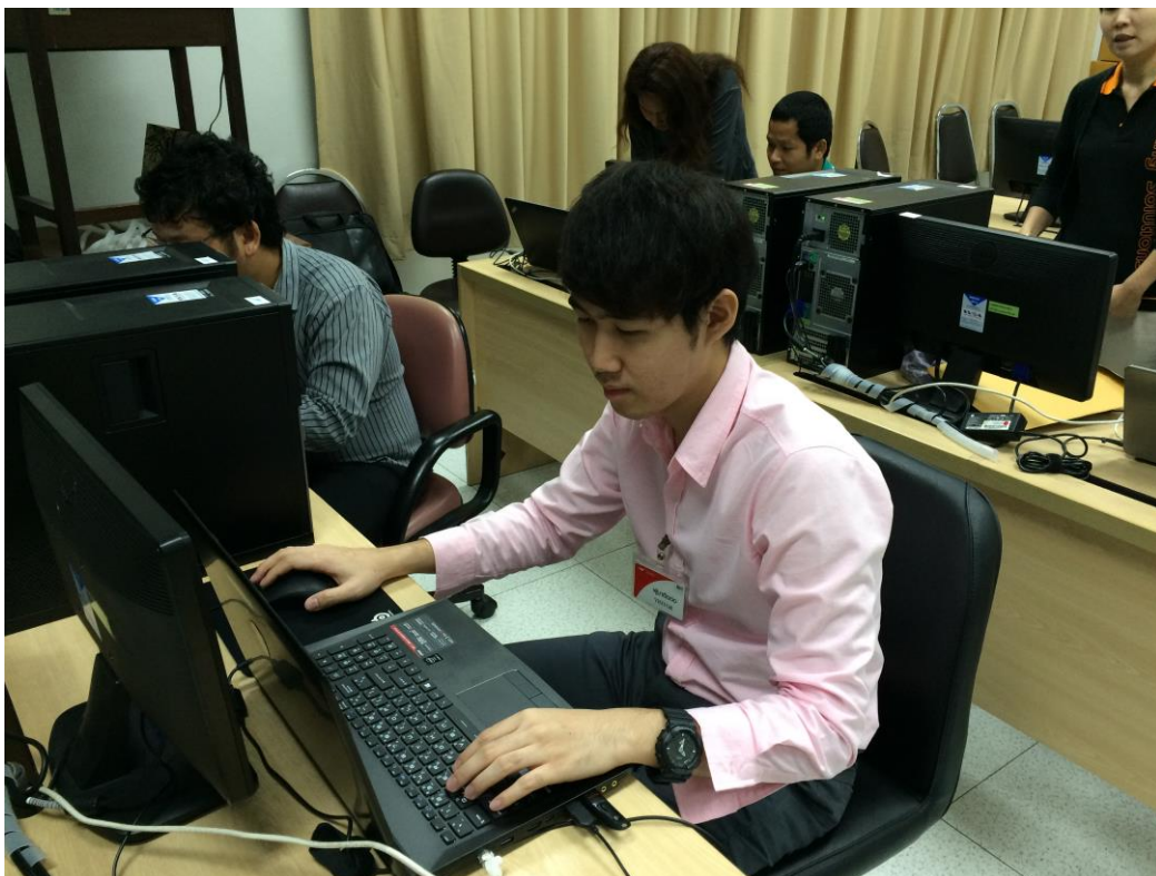
รูปที่ ก.2 พัฒนาโปรแกรมในส่วนรีพอร์ต