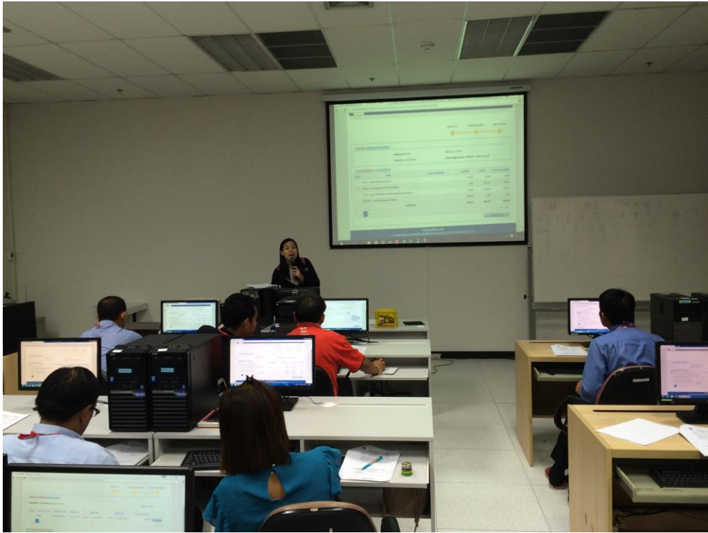
รูปที่ ก.5 ห้องอบรมการใช้โปรแกรมบันทึกข้อมูลของเว็บไปรษณีย์