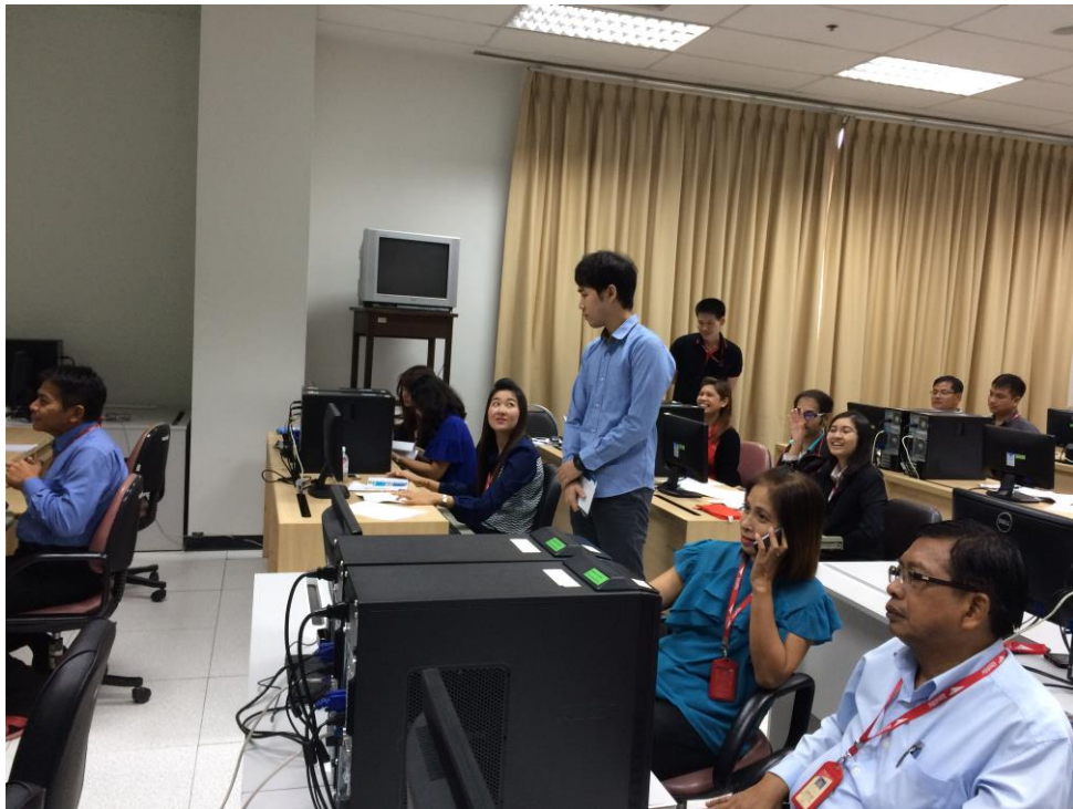
รูปที่ ก.4 เทรนนิ่งลูกค้าเรื่องการสมัครสมาชิกของเว็บไปรษณีย์