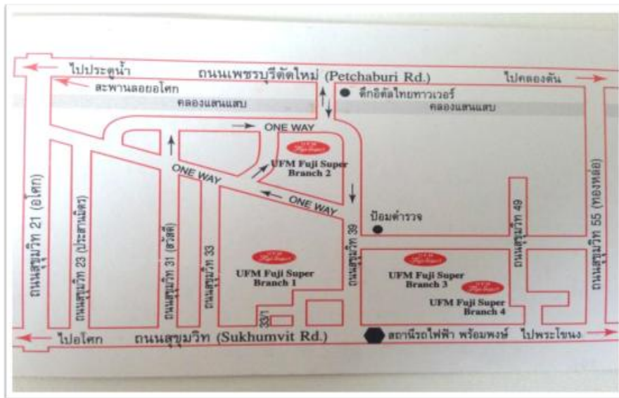
รูปที่ 3.1 แผนที่บริษัท ยูเอฟเอ็มฟูจิ ซูเปอร์ จำกัด