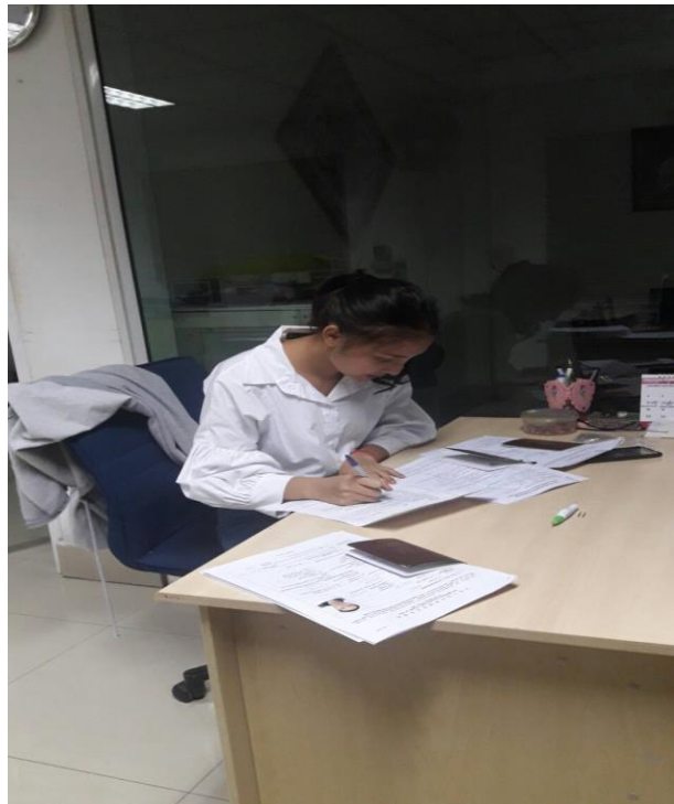
ตรวจเอกสารการยื่นวีซ่าของลูกค้า