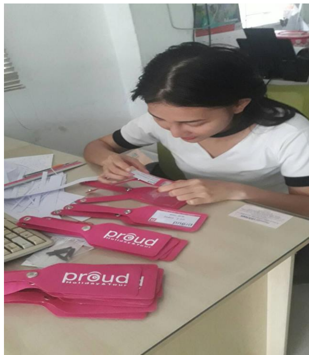
นำป้ายชื่อที่ปรีนเรียบร้อยแล้วใส่ซองเพื่อเตรียมติดกระเป๋าลูกค้า