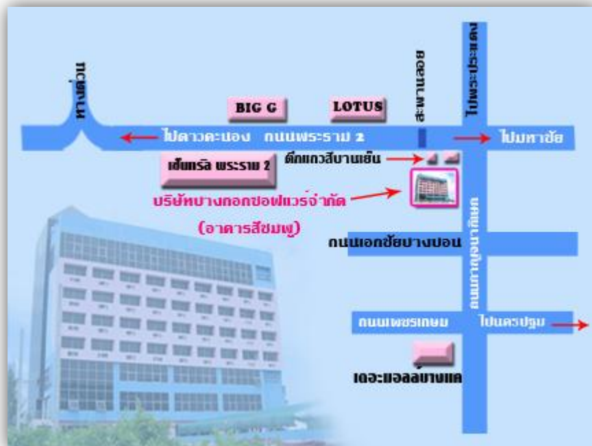
รูปที่ 1.1 แผนที่ตั้งบริษัท บางกอกซอฟแวร์ จำกัด