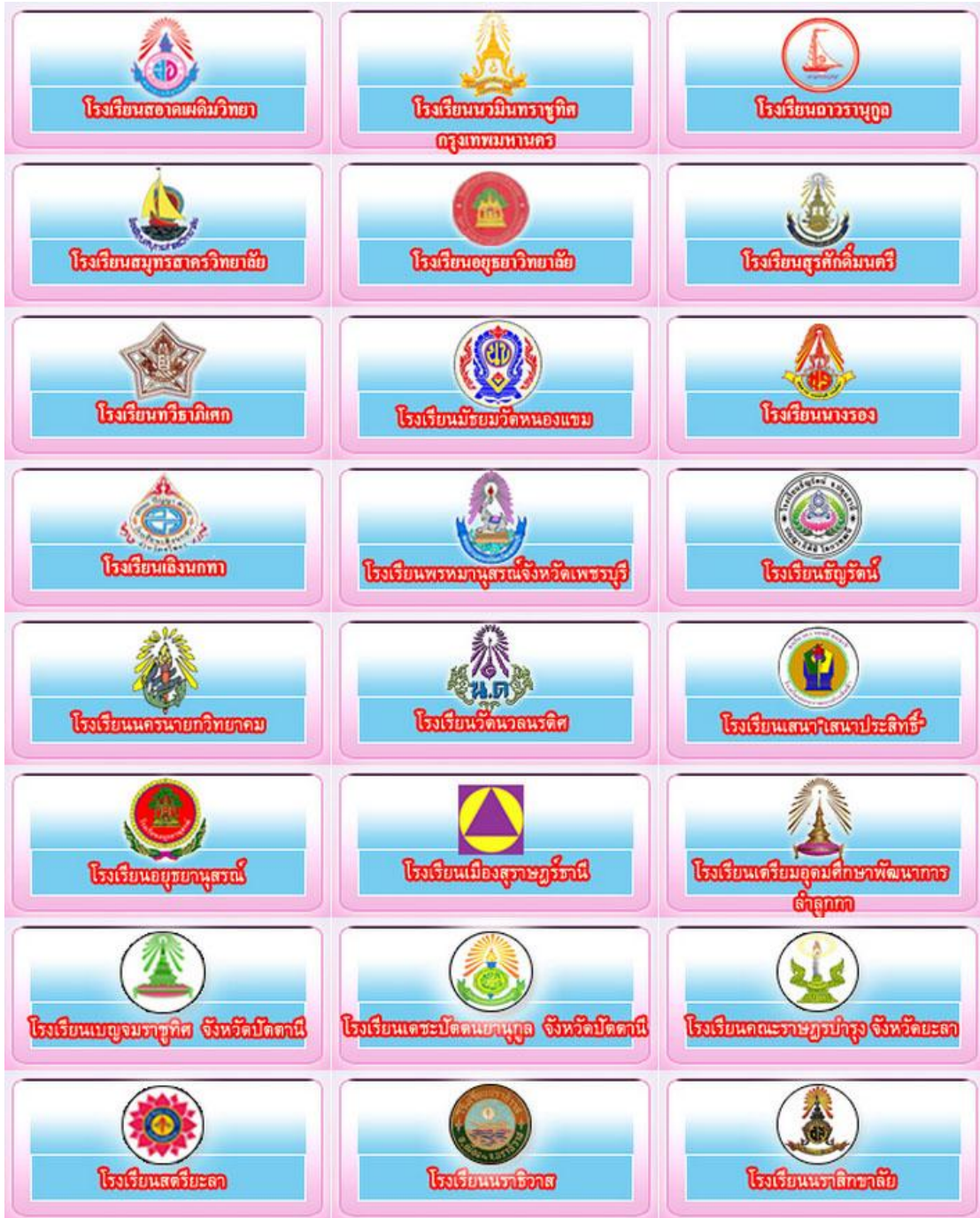
รูปที่ 1.3 ตัวอย่างลูกค้าของบริษัท (ต่อ)