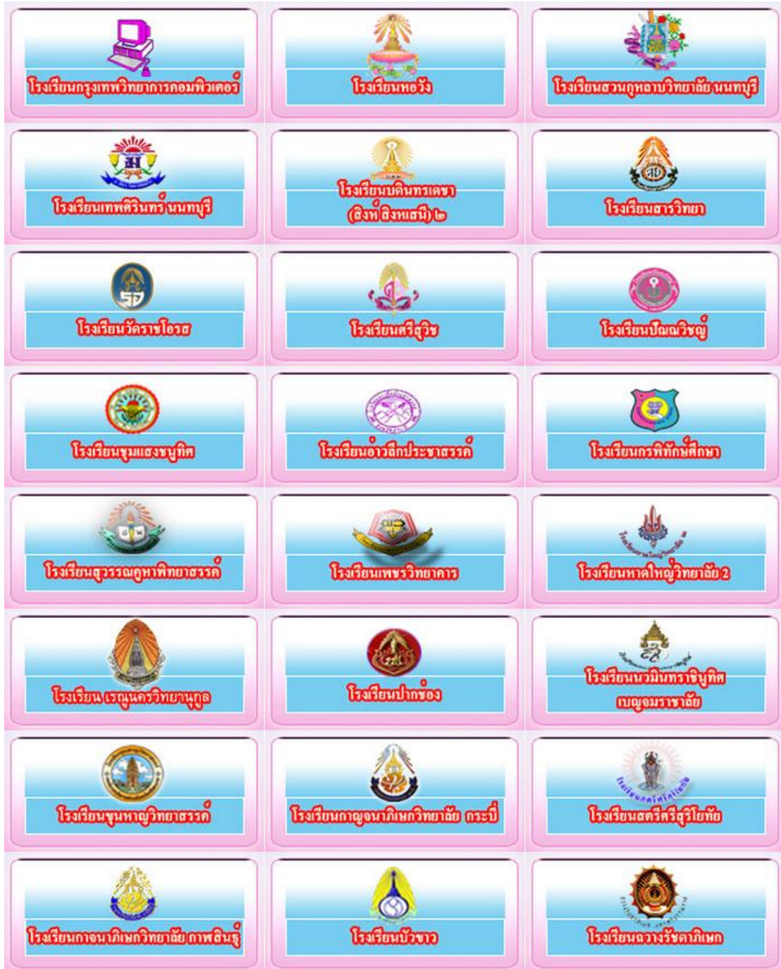
รูปที่ 1.2 ตัวอย่างลูกค้าของบริษัท บางกอกซอฟแวร์ จำกัด

บริษัท บางกอกซอฟแวร์ จำกัด ดำเนินงานเกี่ยวกับการพัฒนาซอฟต์แวร์เกี่ยวกับสื่อการเรียนการสอนและให้บริการเช่า หรือเช่าซื้อเครื่องคอมพิวเตอร์และอุปกรณ์ทางด้านฮาร์ดแวร์อื่นๆ