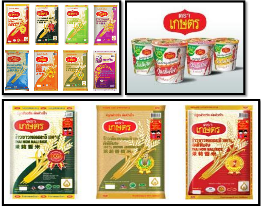
รูปที่ 1.2 ผลิตภัณฑ์สินค้าตราเกษตร

บริษัท ไทยฮา จำกัด (มหาชน) เป็นบริษัทที่ผลิตและจัดจำหน่ายสินค้าตราเกษตร ในกลุ่มของอาหาร ได้แก่ ข้าวและธัญพืชต่างๆและสินค้าเกษตรแปรรูป