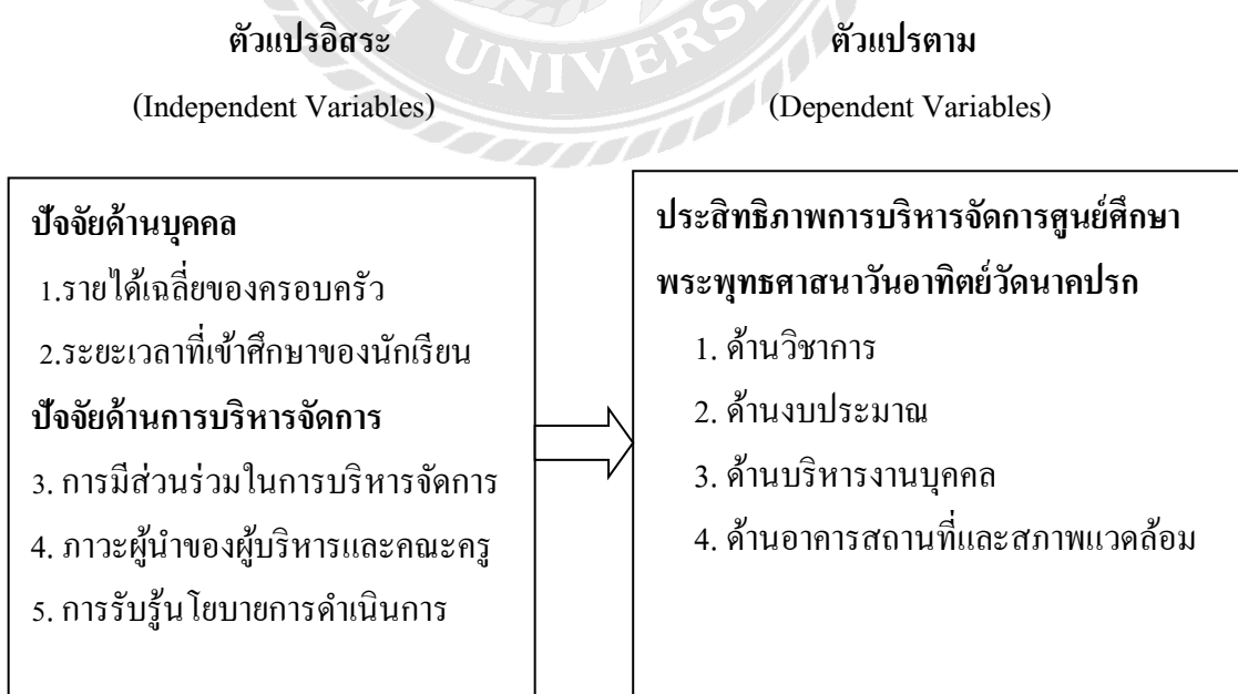
ภาพที่ 1 กรอบแนวคิดการวิจัย

ดังนั้นการทำวิจัยเรื่อง ประสิทธิภาพการบริหารจัดการศูนย์ศึกษาพระพุทธศาสนาวันอาทิตย์วัดนาคปรก เขตภาษีเจริญ กรุงเทพมหานคร จากการศึกษาทบทวนวรรณกรรม ผู้วิจัยจึงได้วางกรอบแนวคิดในการวิจัยไว้ ดังนี้