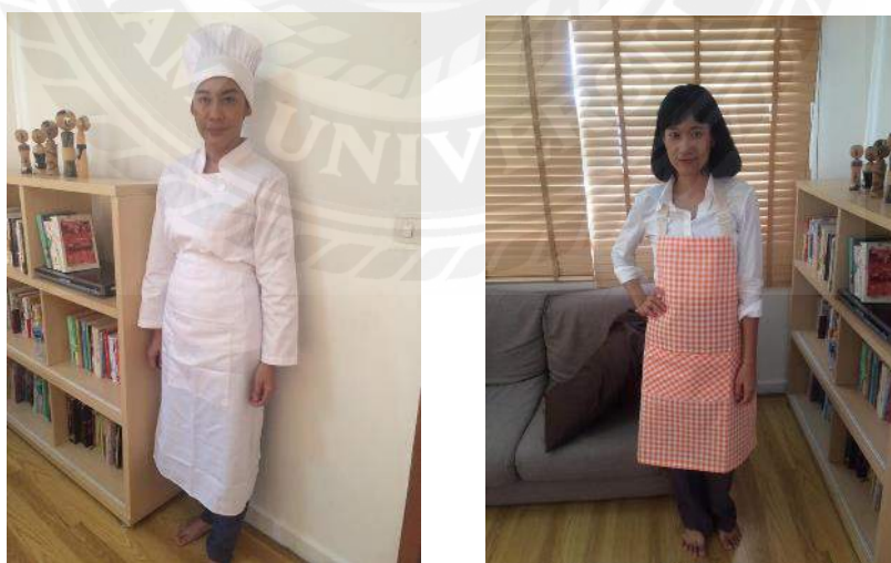
รูปที่ 4.3 ชุดนักแสดง Costume และ นักแสดง

4.2.1 สตอรี่บอร์ด จะมีเรื่องราวเป็น ความรักของแม่ ในรูปแบบที่แม่แสดงออก สื่อถึงความหมายของ สาร ด้านอนุมูลอิสระทั้ง 6 เท่า