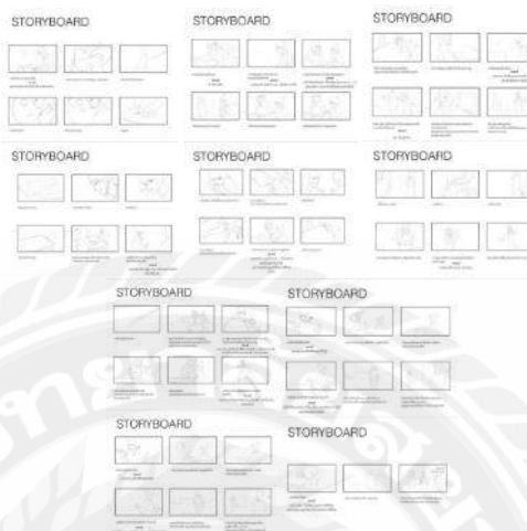
รูปที่ 4.2 Storyboard เสนอแก่ลูกค้า

คือ การนำงานทั้งหมดที่เตรียมไว้ก่อนถ่ายทำเสนอแก่ลูกค้าในรายละเอียดทั้งหมด เช่น สตอรี่บอร์ด นักแสดง , ชุดนักแสดง, สถานที่ถ่ายทำ เพื่อให้ลูกค้าได้รับทราบ และหากมีบางสิ่งที่คุณลูกค้าไม่เห็นด้วยหรือต้องปรับเปลี่ยน บริษัทจะแก้ไข จนกว่าลูกค้าจะพอใจ และ ตกลงกันได้รายละเอียดทั้งหมด