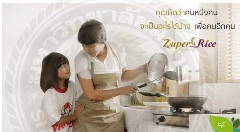
รูปที่ 4.6 ไรส์วีดีโอข้าว Super Rice

ปัญหาและอุปสรรค คือ ปัญหาด้านเวลาและงบประมาณ ในการถ่ายทำนั้นอาจจะล่าช้าด้วยอารมณ์ของนักแสดงเอง , แสงและไฟในฉาก หรือ สถานที่ ยังไม่สมบูรณ์ ก็อาจจะทำให้การถ่ายทำล่าช้า โดยการทำงานนั้นจะต้องเป็นไปตามแบบแผนที่วางไว้ เพราะงบประมาณในการผลิตนั้นค่อนข้างเยอะ เมื่อเวลาถ่ายทำล่าช้า งบประมาณที่จ้างช่างไฟ และ ทีมกล้อง ก็จะเพิ่มขึ้นอีก จะทำให้เปลืองค่าใช้จ่าย และลูกค้าอาจไม่พอใจได้