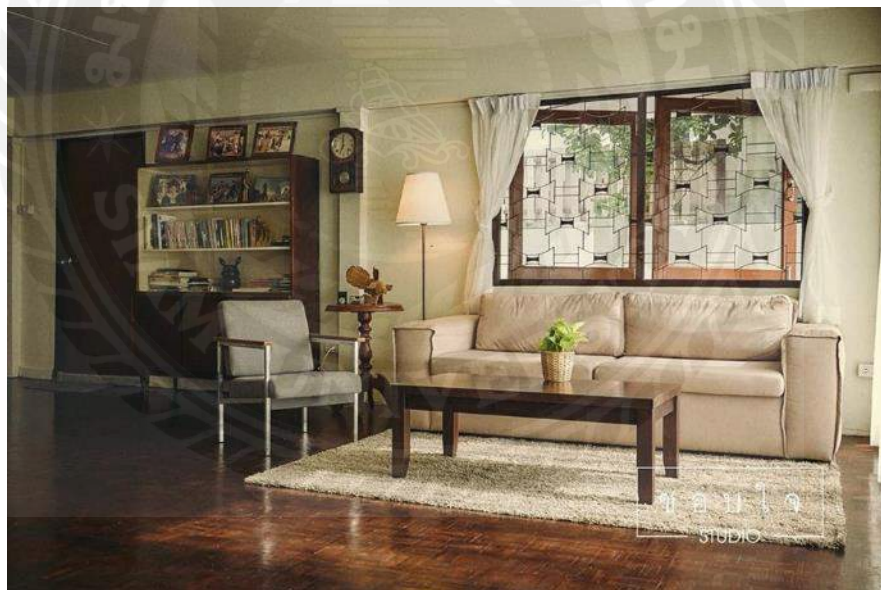
รูปที่4.4 สถานที่ถ่ายทำ ชอบใจ สตูดิโอ