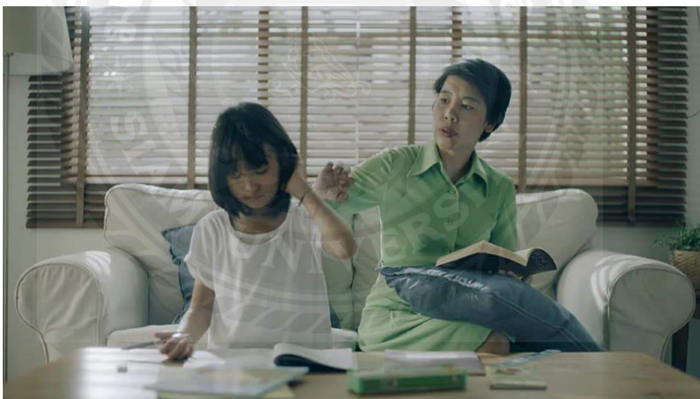
ภาพประกอบที่ 4.9 โฆษณาข้าว Zuper rice