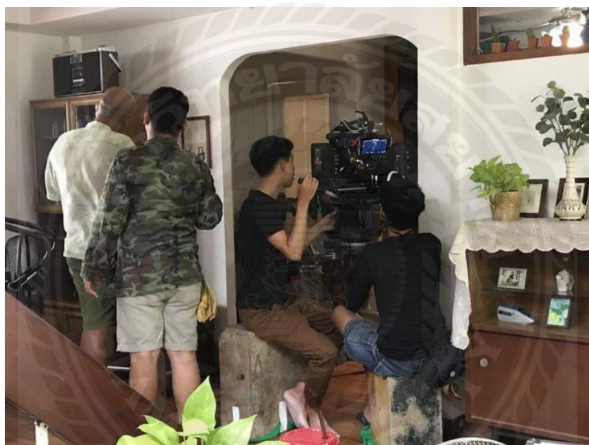
รูปที่4.5 ออกกองเพื่อถ่ายวีรลออนไลน์

การออกกองถ่ายวีรลวิดีโอ คือ การถ่ายวิดีโอเพื่อนำไปลงในสื่อออนไลน์ไม่ว่าจะเป็น Fanpage Facebook หรือ Youtube โดยโปรดิวเซอร์มีหน้าที่ดูแลว่านักแสดงต้องทำท่าทางแบบไหน ต้องแต่งตัวแบบไหนชุดไหนเข้าฉาก เป็นการวางแผนมาแล้ว ในก่อนหน้านี้จากการหารเฟอเฟอเรน ทั้งเสื้อผ้า หน้าผม ท่าทาง ว่าให้ออกมาแนวไหน อารมณ์ไหน ตามคอนเซปที่ลูกค้าอยากได้ ขณะถ่ายทำเพื่อแก้ไขและแนะนำความต้องการของลูกค้าแก่ โปรดักชั่นเฮาส์