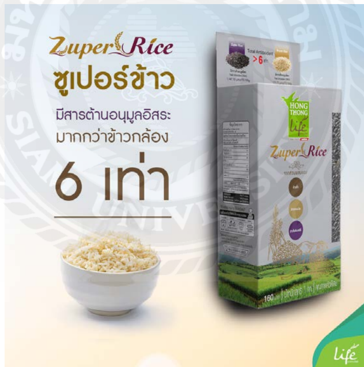
รูปที่ 4.1 รูปตัวอย่างสินค้า ข้าว Zuper rice

รับบริฟจากลูกค้าโดยผลิตภัณฑ์จะเป็นสินค้าข้าวราสเบอร์รี่ตรา ZuperRice ให้ถ่ายทำวีรัลวิดีโอออนไลน์ โดยให้สื่อความหมาย ความเป็นข้าวให้ออกมาในแบบที่ไม่เหมือนใคร เพราะสินค้าตัวนี้เป็นข้าวที่แตกต่างจากข้าวอื่นๆ เพราะมีสารต้านอนุมูลอิสระมากกว่าข้าวกล้อง 6 เท่า