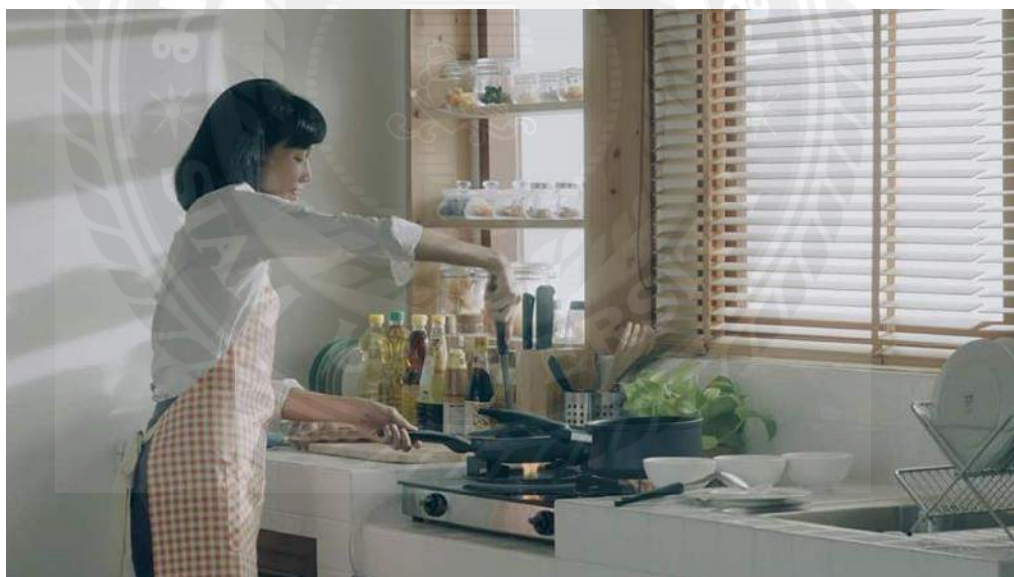
ภาพประกอบที่ 4.8 โฆษณาข้าว Zuper rice