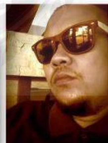
รูปที่ 3.3 ผู้ก่อตั้งบริษัทตัวบรรจงเต็มบรรทัด จำกัด