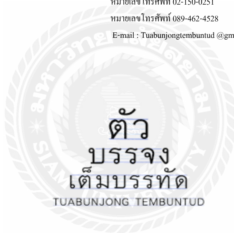
รูปที่ 3.1 ตราสัญลักษณ์ (Logo) บริษัท ตัวบรรจงเต็มบรรทัด จำกัด