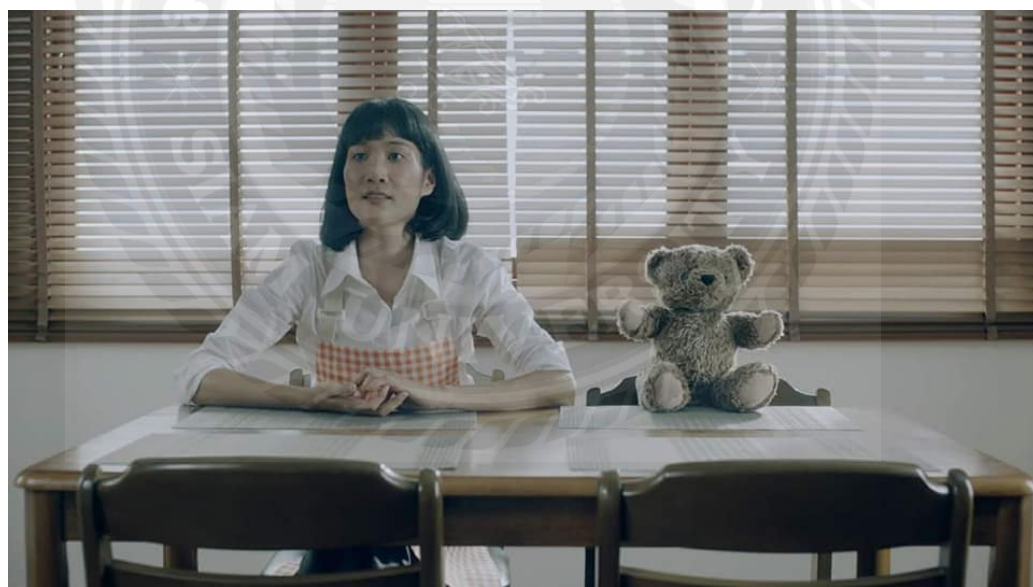
ภาพประกอบที่ 4.10 โฆษณาข้าว Zuper rice