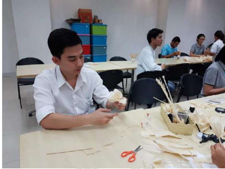
รูปภาพที่1 ภาพบรรยากาศการทำงาน