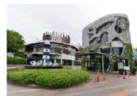
3 สถานที่เกี่ยวกับสิ่งแวดล้อม ที่ต้องไม่พลาด