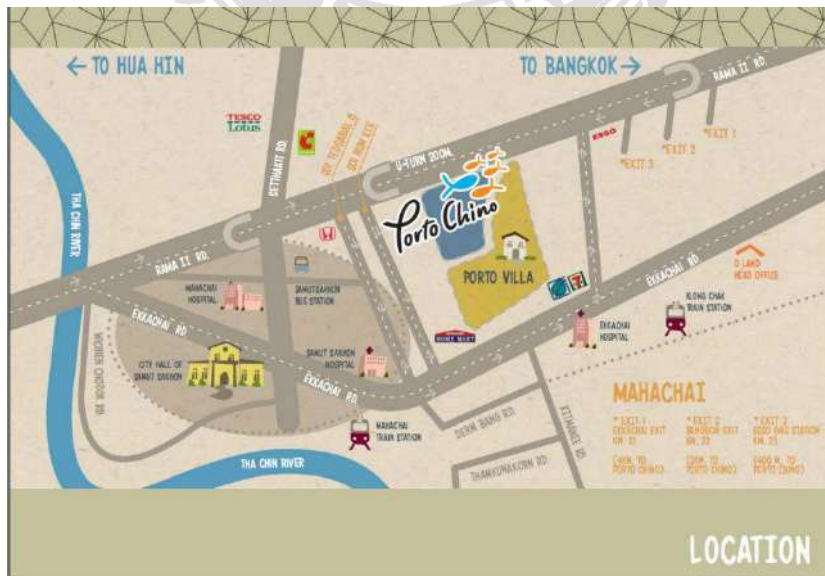
รูปที่ 3.1.2 แผนที่ โครงการ พอร์โต้ ซิโน้