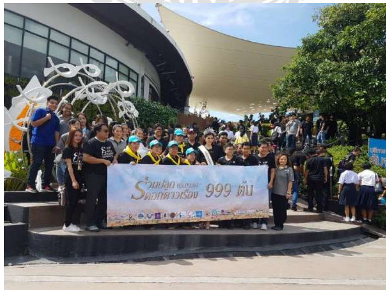
รูปภาพที่4 ภาพบรรยากาศการทำงาน