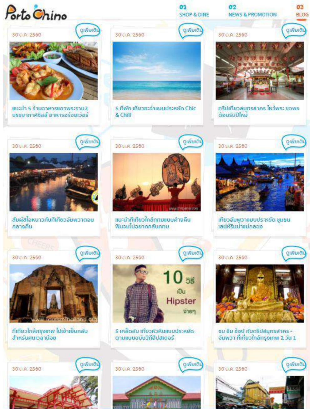
รูปจากเว็บไซต์ Porto Chino ที่แนะนำสถานที่ท่องเที่ยว

จึงได้ทำโครงการ Porto Chino CSR นี้ขึ้นให้กับกลุ่มลูกค้าทาง Facebook FanPage และใน เว็บไซต์ Porto Chino ให้กับกลุ่มลูกค้าที่สนใจเข้าร่วมทำกิจกรรมการท่องเที่ยวเชิงอนุรักษ์ธรรมชาติและสิ่งแวดล้อมและยังสร้างรายได้ให้กับชาวบ้านในพื้นที่ของ จ. สมุทรสาคร โดยมี 10 สถานที่ที่สามารถทำกิจกรรมท่องเที่ยวเชิงอนุรักษ์ ดังต่อไปนี้