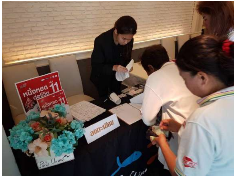
รูปภาพที่ ๕ ภาพบรรยากาศการทำงาน