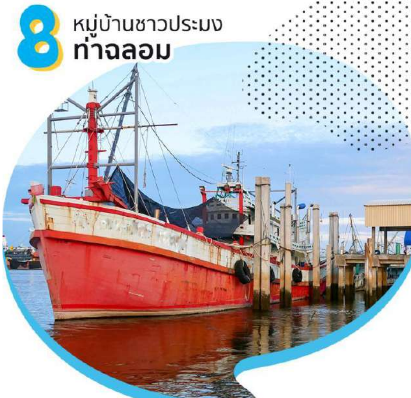
รูปภาพที่ 9 ภาพการปฏิบัติโครงการ