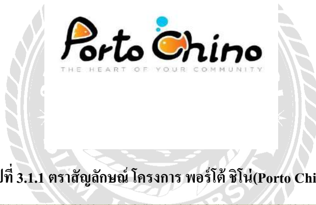
รูปที่ 3.1.1 ตราสัญลักษณ์ โครงการ พอร์โต้ ซิโน้(Porto Chino)