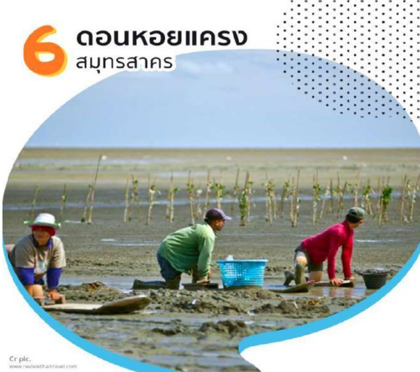
รูปภาพที่ 7 ภาพการปฏิบัติโครงการ