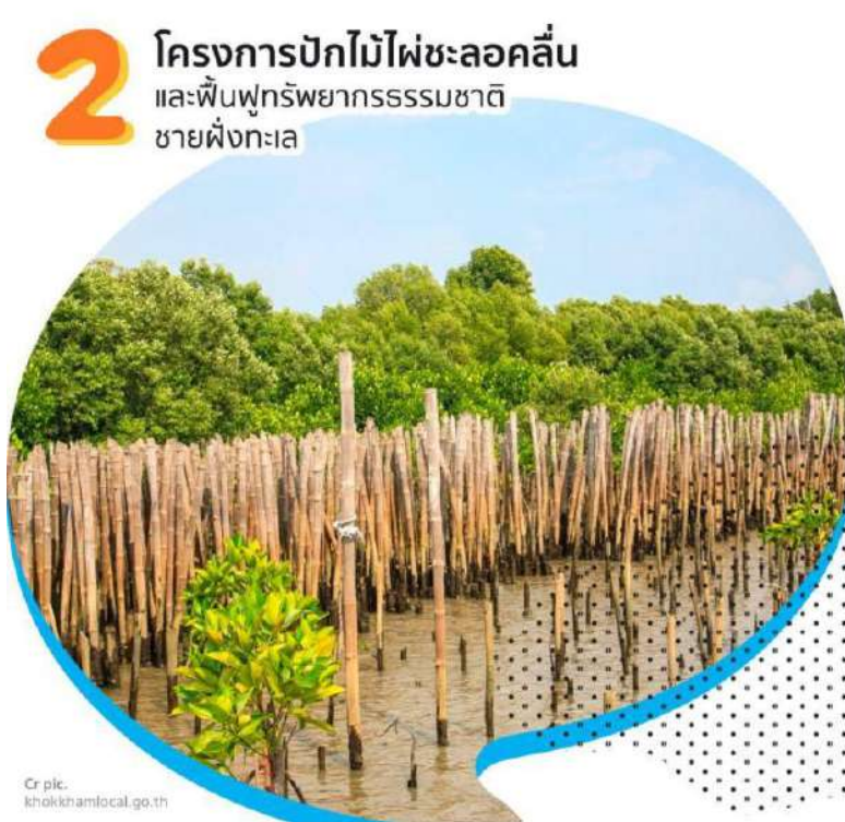
รูปภาพที่3 ภาพการปฏิบัติโครงการงาน