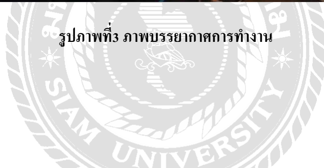
รูปภาพที่3 ภาพบรรยากาศการทำงาน