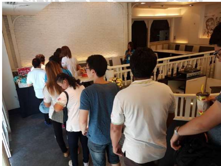
รูปภาพที่ ๖ ภาพบรรยากาศการทำงาน