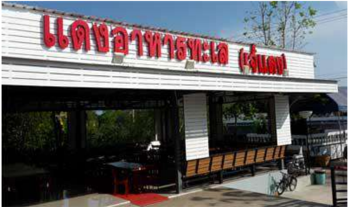
1.1 ร้านอาหารแดงอาหารทะเล