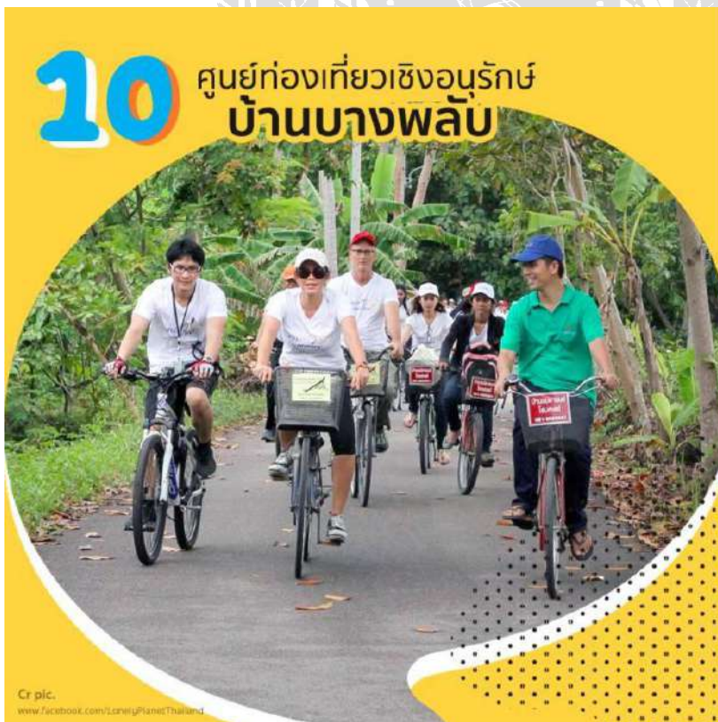
รูปภาพที่ 11 ภาพการปฏิบัติโครงการ