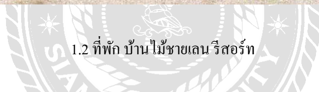
1.2 ที่พัก บ้านไม้ชายเลน รีสอร์ท