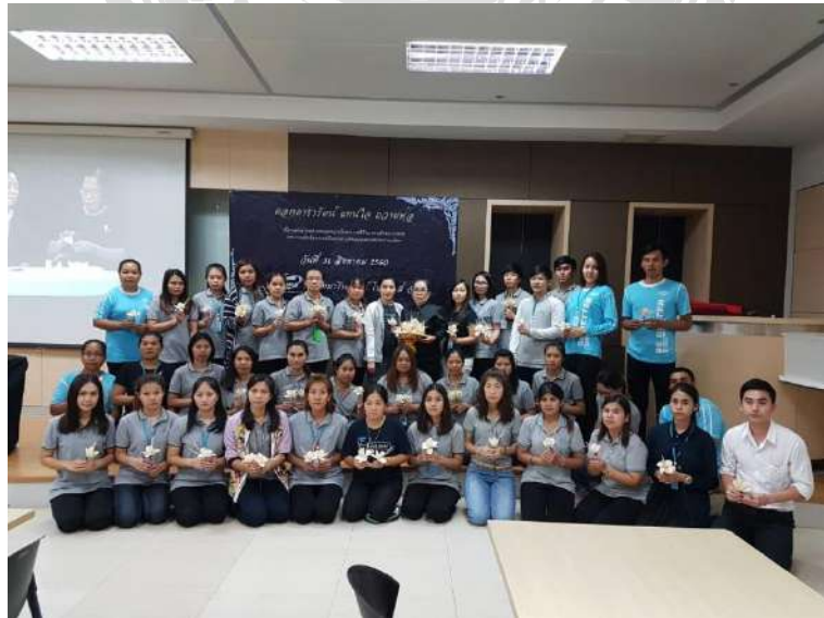
รูปภาพที่2 ภาพบรรยากาศการทำงาน