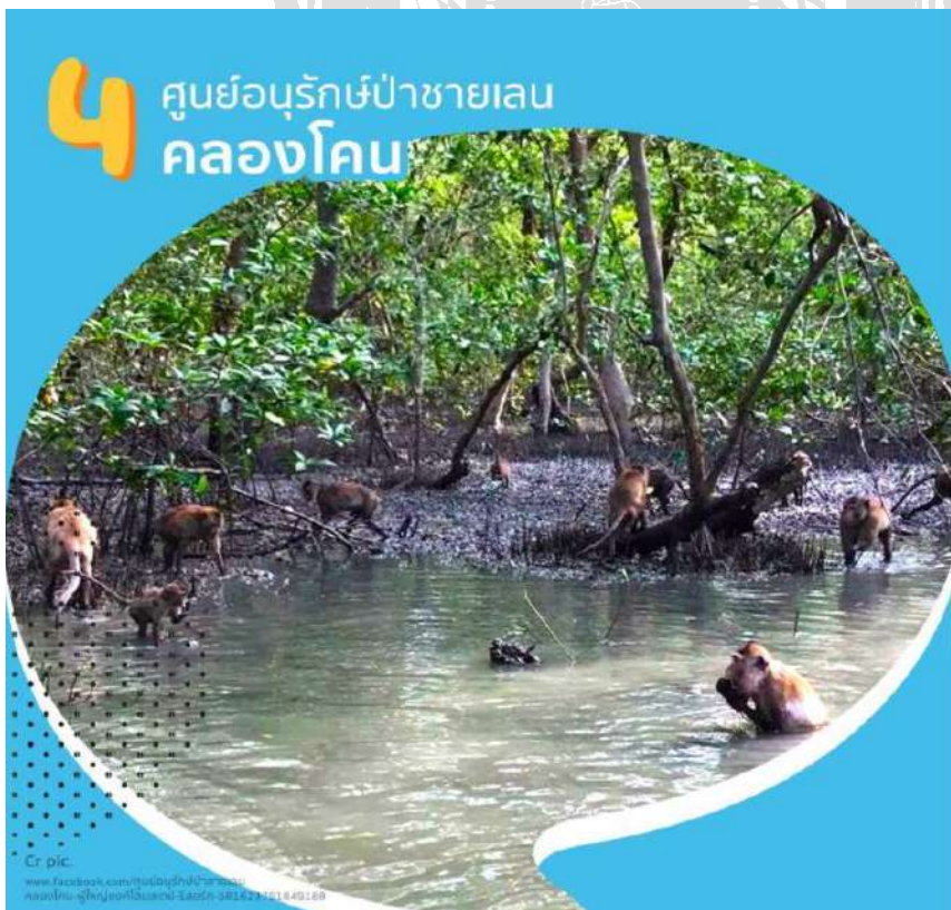
รูปภาพที่ ๓ ภาพการปฏิบัติโครงการ