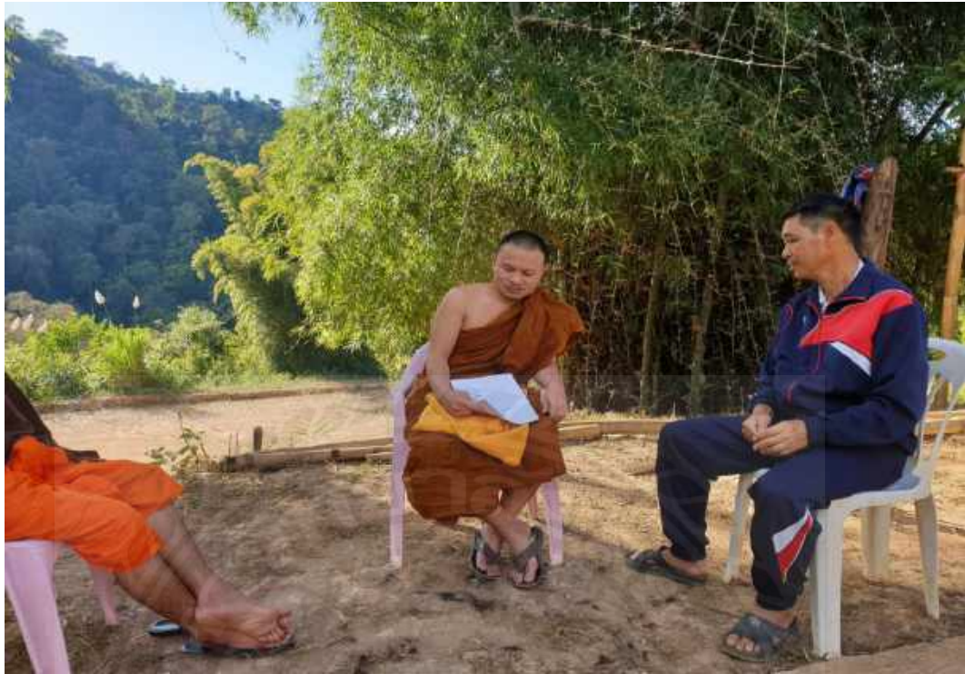
ผู้อำนวยการใน โรงเรียนทางอ้อม