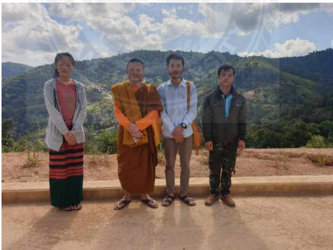
คุณครูในโรงเรียนชั้นสูง