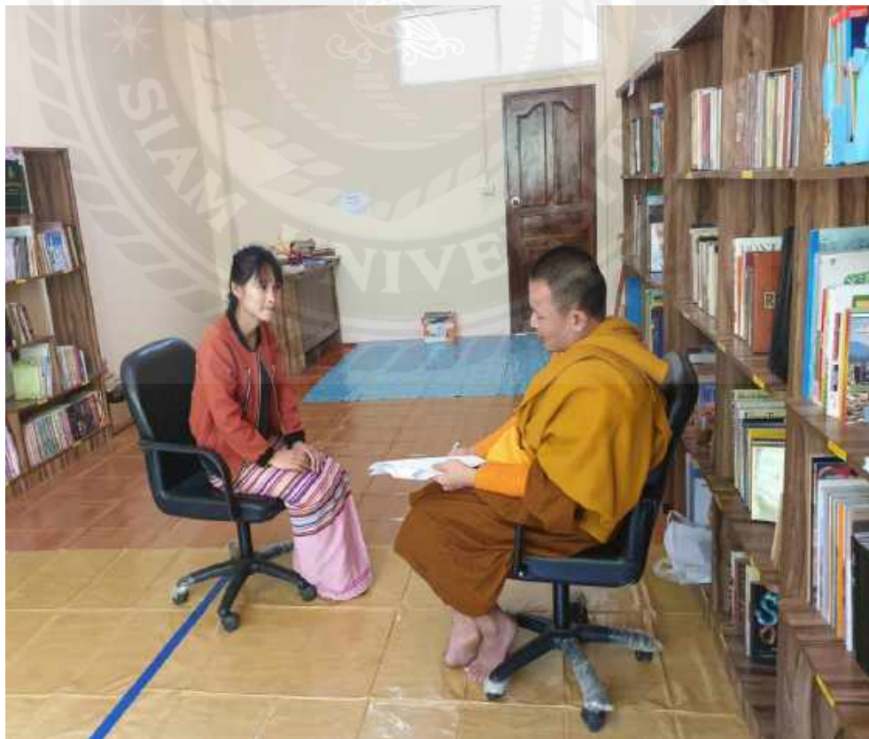
การสัมภาษณ์จากนักเรียนในโรงเรียน