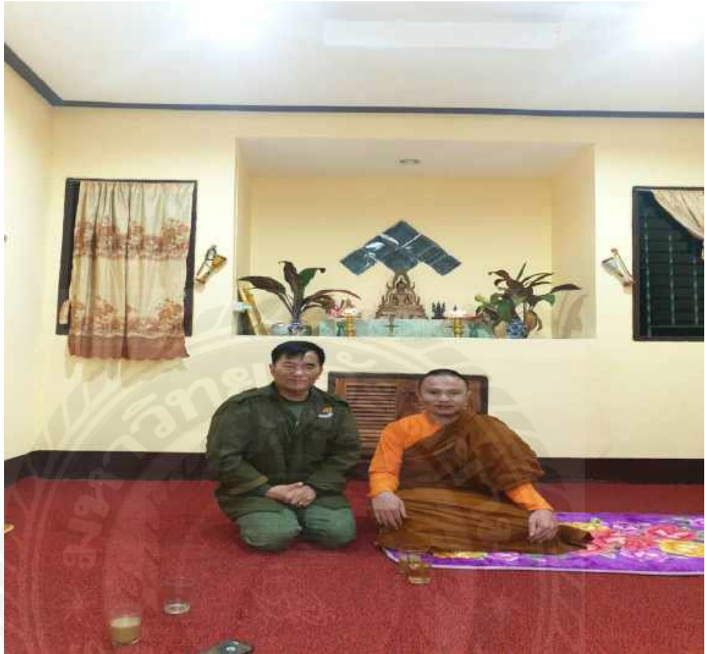
เจ้าหน้าที่ระดังสูง เจ้าศึกหลวงอ่องมายณ์