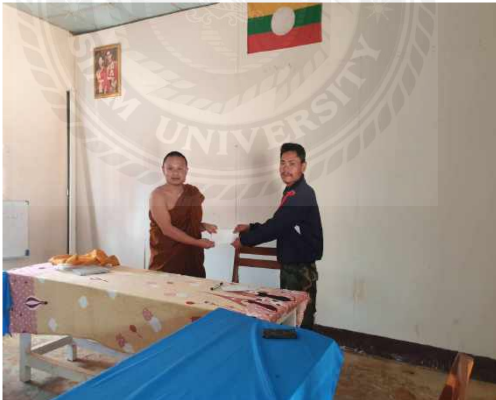
คุณครูและเจ้าหน้าที่ในโรงเรียนชั้นกลาง