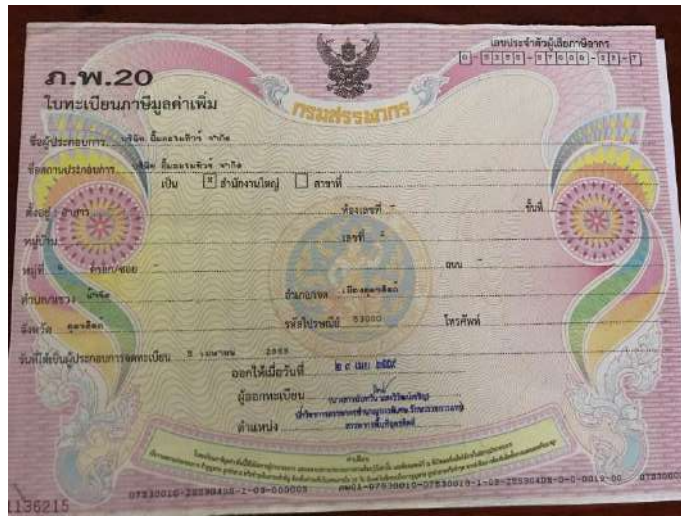
รูปที่ 3.4 ใบทะเบียนภาษี บริษัท ยี่มะละไมทัวร์ จำกัด