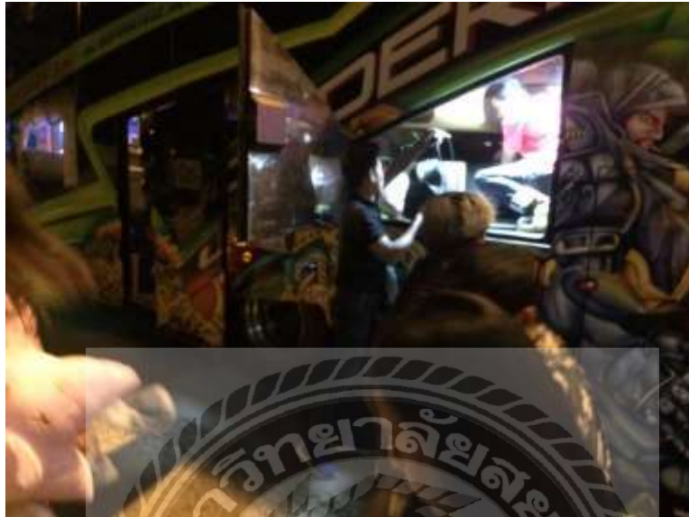
รูปที่ 5 ตัวอย่างรูปภาพการรับลูกค้า

4.1 การต้องรับลูกค้า ลงทะเบียน เก็บสัมภาระ และบริการอื่นๆที่เกี่ยวข้อง ก่อนการเดินทาง และ ส่งลูกค้าภายหลังจากการเดินทางเสร็จสิ้นลง