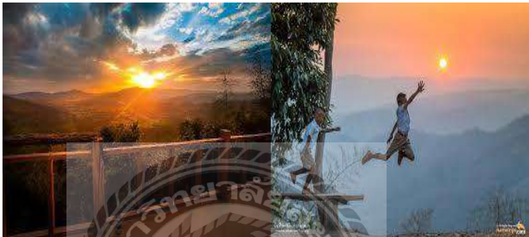
( รูปที่ 4.2  )

2) ผาเก็บตะวัน ตั้งอยู่ที่อุทยานแห่งชาติทับลาน ต.ไทยสามัคคี อ.วังน้ำเขียว จ.นครราชสีมา เป็นที่ตั้งของหลักแบ่งเขตจังหวัดปราจีนบุรี และจังหวัด นครราชสีมาเป็นจุดชมวิวที่สวยงามแห่งหนึ่งของอุทยานแห่งชาติทับลานมีวิวธรรมชาติที่สวยงามสามารถชมพระอาทิตย์ขึ้นและลับขอบฟ้าในยามเย็น นอกจากนี้หากในช่วงฤดูฝนอาจได้มีโอกาสพบเห็นสายหมอกในยามเช้าอีกด้วย