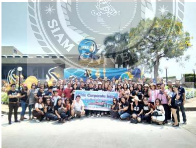
รูปที่ 14 บริษัท ชิค คอร์ปอเรชั่นอินเตอร์ งานท่องเที่ยวประจำปี