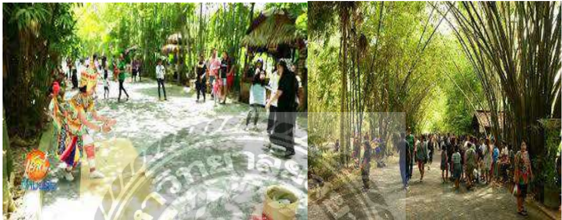
( รูปที่ 4.4 )

4) ตลาดสินค้าชุมชนบ้านบุไผ่ตลาดสินค้าชุมชนบุไผ่เป็นแหล่งที่ซื้อของฝากยอดนิยม เพราะเป็นแหล่งที่เหมาะสมสำหรับการปลูกผักเมืองหนาว โดยเฉพาะกลุ่มผักเมืองหนาว และยังเป็นผักปลอดสารพิษที่สามารถเก็บแล้วนำมาจำหน่ายได้ทันที ของฝากยอดฮิตอีกอย่างที่มาแล้วจะไม่ซื้อไม่ได้ก็คือ เห็ดหลากหลายชนิด เช่น เห็ดหอม เห็ดนางฟ้า และอีกมากมาย แล้วยังมีผลไม้ที่เป็นของฝากอีกอย่างที่ไม่ควรพลาดก็คือ องุ่นแดง องุ่นเขียวและองุ่นไร้ ที่ตลาดสินค้าชุมชนบุไผ่ยังมีของฝากอีกมากมายให้ทุกคนได้เลือกซื้อตามอัธยาศัย