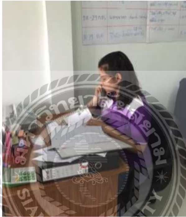
รูปที่ 2 ตัวอย่างรูปภาพการติดต่อประสานงานต่างๆผ่านทางโทรศัพท์

เมื่อได้โปรแกรมนำเที่ยวที่วางแผนไว้ข้างต้นแล้ว ขั้นตอนต่อไป คือ การติดต่อขอข้อมูลกับสถานที่เที่ยว โรงแรมที่พัก ร้านอาหาร รถที่จะใช้ในการเดินทาง รวมถึงการติดต่อกับลูกค้า เพื่อไม่ให้เกิดข้อผิดพลาดขั้นตอนนี้จึงสำคัญมากและต้องปฏิบัติตามลำดับเพื่อระงับข้อผิดพลาดที่อาจจะเกิดขึ้น โดยข้อมูลที่สื่อสารนั้นต้องถูกต้องทั้งในเรื่องพยัญชนะและตัวเลขและข้อมูลสำคัญต่างๆตามที่อีกฝ่ายสื่อสารมา