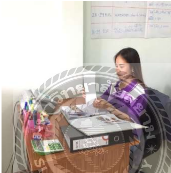
รูปที่ 1 ตัวอย่างรูปภาพการแยกเอกสารตามแฟ้มงาน

เอกสารสำคัญของบริษัทคัดแบ่งตามแฟ้มงาน เรียนรู้เอกสารทั้งหมด ทำความเข้าใจและสามารถแบ่งประเภทของเอกสารได้ โดยแต่ละแฟ้มจะถูกจำกัดชนิดของเนื้อหาในเอกสาร และแบ่งแยกตามความสำคัญและจำพวกของเอกสาร ข้อมูลลูกค้า โรงแรมที่พัก ร้านอาหาร ยานพาหนะ ใบกำกับภาษี รายรับ – รายจ่าย ข้อมูลแหล่งท่องเที่ยว ฯลฯ จัดเก็บเข้าแฟ้มงาน