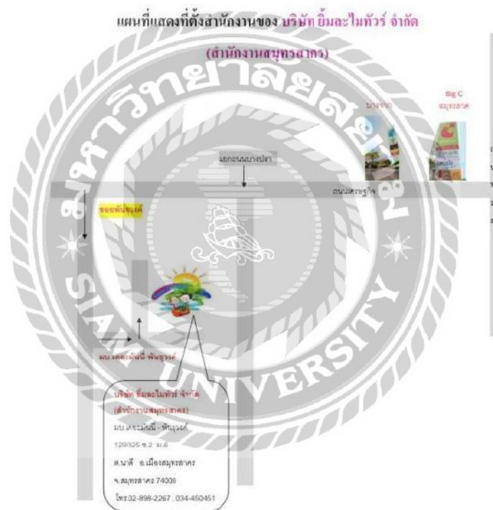
รูปที่ 3.1. แผนที่บริษัท ยี่มะไมทัวร์ จำกัด