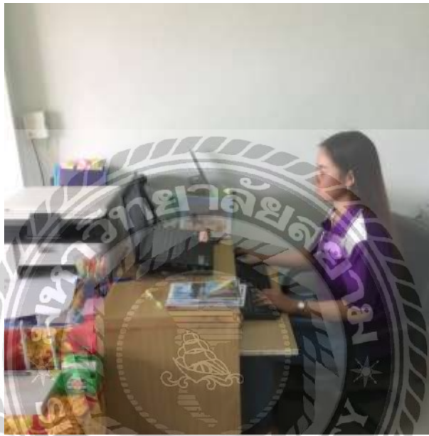
รูปที่ 3 ตัวอย่างรูปภาพการทำเอกสาร โปรแกรม กำหนดการ

3.การคำนวณค่าใช้จ่ายจากทั้งหมดเพื่อให้ได้ราคาขายเสนอให้ลูกค้า