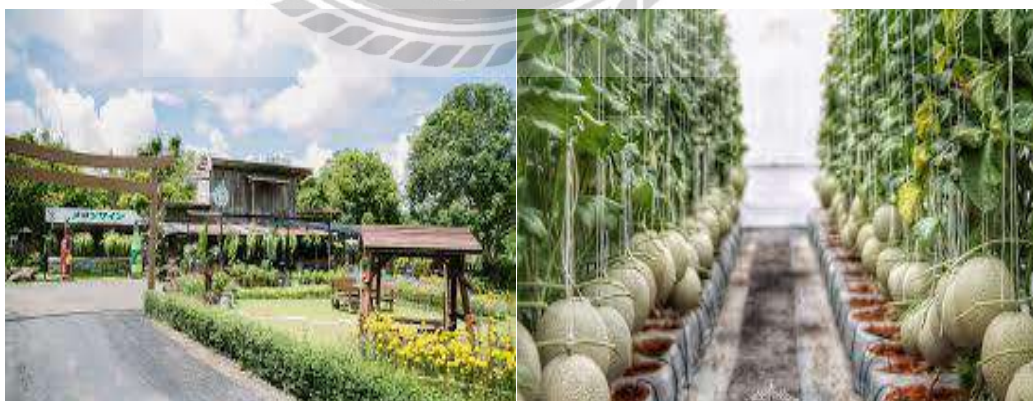
( รูปที่ 4.3 ที่มา : https://www.matichonweekly.com สืบค้นเมื่อวันที่ 29 มีนาคม 2561 )

3) รักจังเมล่อนฟาร์ม นอกจากสวนองุ่น สวนดอกไม้ และแปลงผักปลอดสารพิษแล้ว ที่อำเภอวังน้ำเขียวยังมีไร่เมล่อนสุดน่ารักให้เราเข้าไปเยี่ยมชมกันอีกด้วย ซึ่งที่นี่เป็นฟาร์มเมล่อนเล็กๆ บางแปลงเปิดให้นักท่องเที่ยวได้เข้าเยี่ยมชม มีร้านกาแฟและเครื่องดื่มไว้ต้อนรับนักท่องเที่ยว