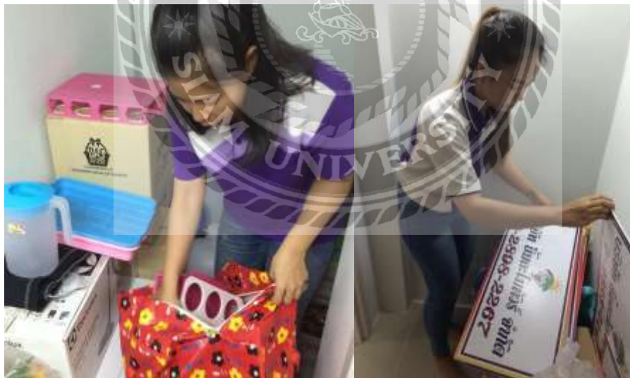
รูปที่ 10 ตัวอย่างรูปภาพการเตรียมอุปกรณ์ต่างๆ