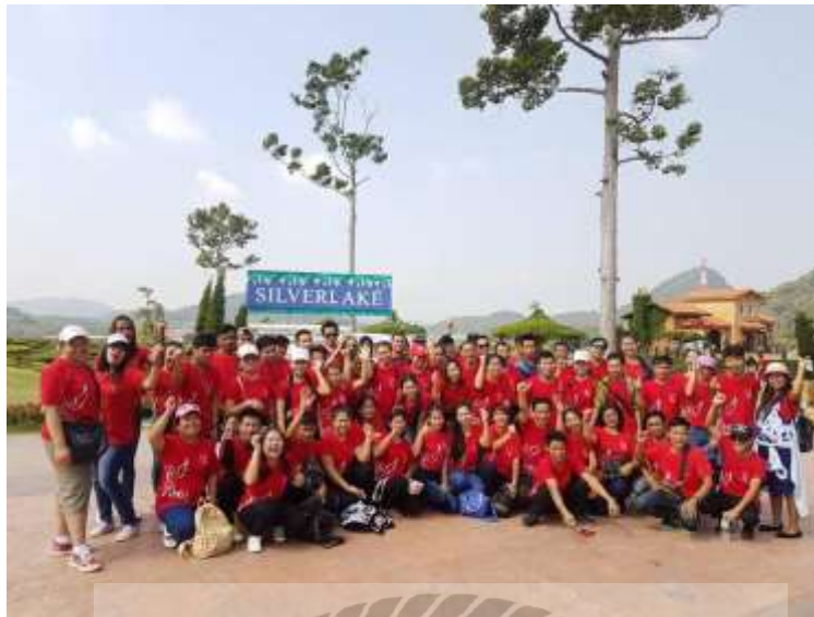
รูปที่ 13 บริษัท ซอสพริกไทยรุ่งเรือง จำกัด งานท่องเที่ยวประจำปีของบริษัท