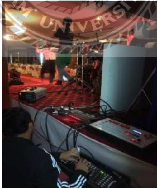
รูปที่ 12 ตัวอย่างรูปภาพงานเบื้องหลังการคุมแสง สี เสียง