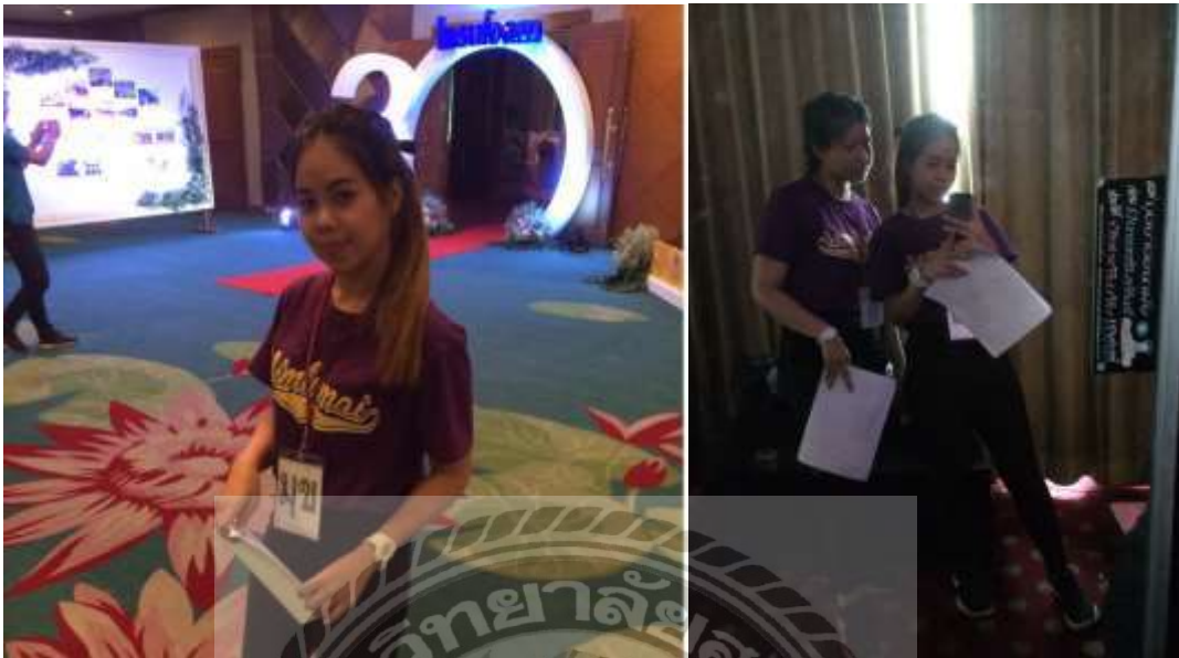
รูปที่ 11 ตัวอย่างรูปภาพการดูแลงานสัมมนา