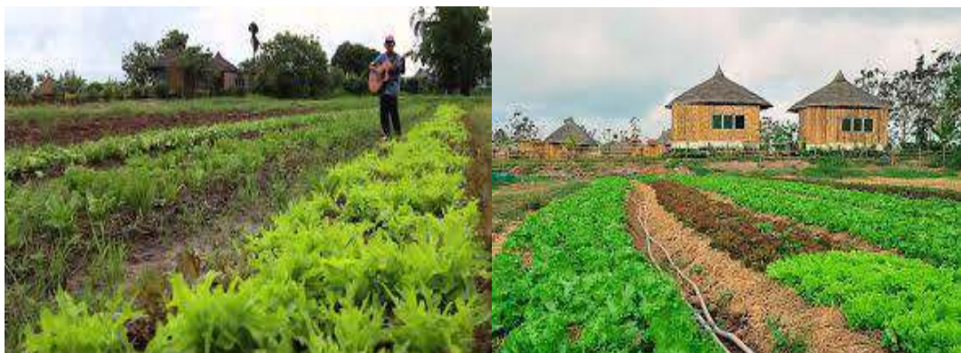
( รูปที่ 4.5 ที่มา : https://www.touronthai.com สืบค้นเมื่อวันที่ 29 มีนาคม 2561 )

5) สวนของลุงไกร ชมน้อย ซึ่งตั้งอยู่หมู่ที่ 2 บ้านสุขสมบูรณ์ ตำบลไทยสามัคคี อ.วังน้ำเขียว จ.นครราชสีมา ที่สวนแห่งนี้มีผักปลอดสารพิษจำหน่าย ตลอดทั้งปี สวนผักสลัดและผักปลอดสารนานาชนิด บนพื้นที่กว่า 15 ไร่ เฉพาะผักสลัดมีมากถึง 6 สายพันธุ์ อาทิ สลัดแก้ว สลัดคอร์ส กรีนโอ๊ค เรดโอ๊ค เรดลิฟ บัตเตอร์เฮด นอกจากนี้ ยังมีมะเขือเทศราชินี มะเขือเทศเนื้อ กะหล่ำปลี ข้าวโพดหวาน ฟักทอง บีทรูท ผักจากสวนลุงไกร สด สะอาด อร่อย