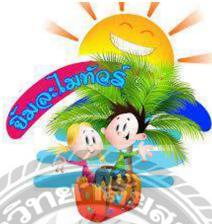
รูปที่ 3.2 ตราสัญลักษณ์ประจำ บริษัท ยิ้มละไมทัวร์ จำกัด