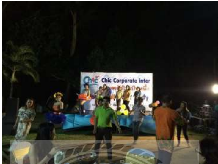
รูปที่ 7 ตัวอย่างรูปภาพกิจกรรมยามค่ำคืน

4.3 กิจกรรมปาร์ตี้ยามค่ำคืน คือ การร่วมรับประทานอาหารมื้อค่ำ และมีกิจกรรมร้องรำ และร่วมเล่นเกม