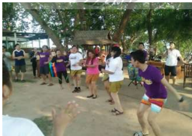
รูปที่ 6 ตัวอย่างรูปภาพกิจกรรมสันทนาการริมหาด

4.2 ดำเนินงานกิจกรรมมอบความสนุกสนานให้กับลูกค้า กิจกรรมสันทนาการ คือ กิจกรรมที่บริษัทจัดให้ลูกค้าร่วมสนุกกัน เป็นกิจกรรมริมหาดหรืออาจเป็นกิจกรรมที่จัดในห้องประชุมของที่พัก