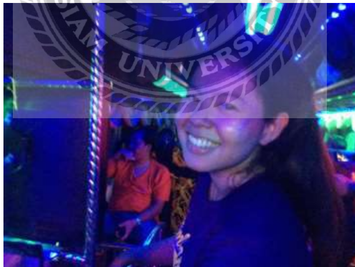
รูปที่ 8 ตัวอย่างรูปภาพกิจกรรมบนรถระหว่างเดินทาง

4.4 กิจกรรมความสนุกสนานระหว่างเดินทาง ร่วมเล่นเกมรับของรางวัล บนรถ รวมทั้งการบริการต่างๆที่เกี่ยวข้อง การเสิร์ฟอาหารว่าง น้ำผลไม้ ขนม