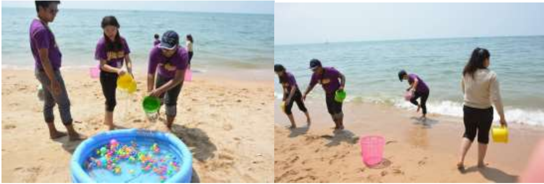
รูปที่ 9 ตัวอย่างรูปภาพการเตรียมความพร้อมกิจกรรมชายหาด