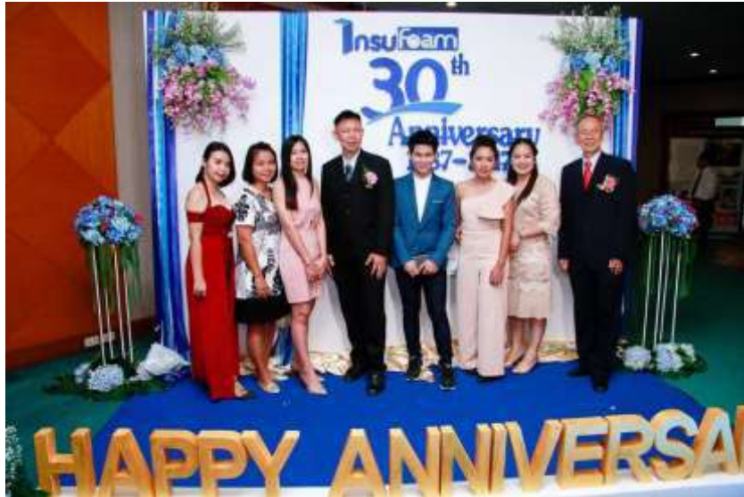
รูปที่ 15 บริษัท ไทยอินซูโฟม จำกัด งานครบรอบ 30 ปี