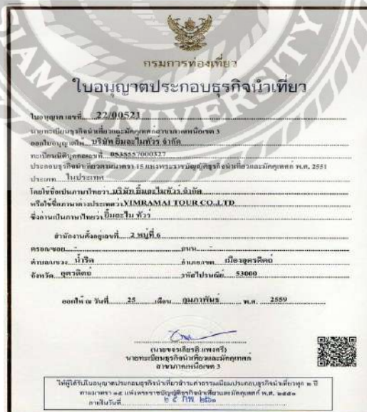
รูปที่ 3.3 ใบประกอบธุรกิจนำเที่ยวบริษัท ยิ้มละไมทัวร์ จำกัด