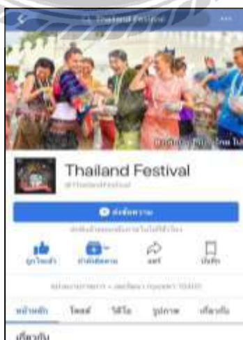
รูปที่ 4.13 สื่อประชาสัมพันธ์ เพจ Thailand Festivals

การประชาสัมพันธ์กิจกรรม “ททท.แยกแแลกยิ้ม” เนื่องจากฝ่ายกิจกรรม การท่องเที่ยวแห่งประเทศไทย ได้มีเฟสบุ๊คเพจ Thailand Festivals ที่ใช้ในการประชาสัมพันธ์กิจกรรมต่างๆที่การท่องเที่ยวแห่งประเทศไทยจัดขึ้น โดยเพจดังกล่าวมียอดผู้ติดตามมากกว่า 74,000 คน ผู้จัดทำโครงการได้เห็นว่าเป็นช่องทางการประชาสัมพันธ์ที่มีประสิทธิภาพ เพื่อให้บุคคลทั่วไปได้รับทราบถึงกิจกรรม “ททท.แยกแแลกยิ้ม” และมาร่วมกิจกรรมมากขึ้น