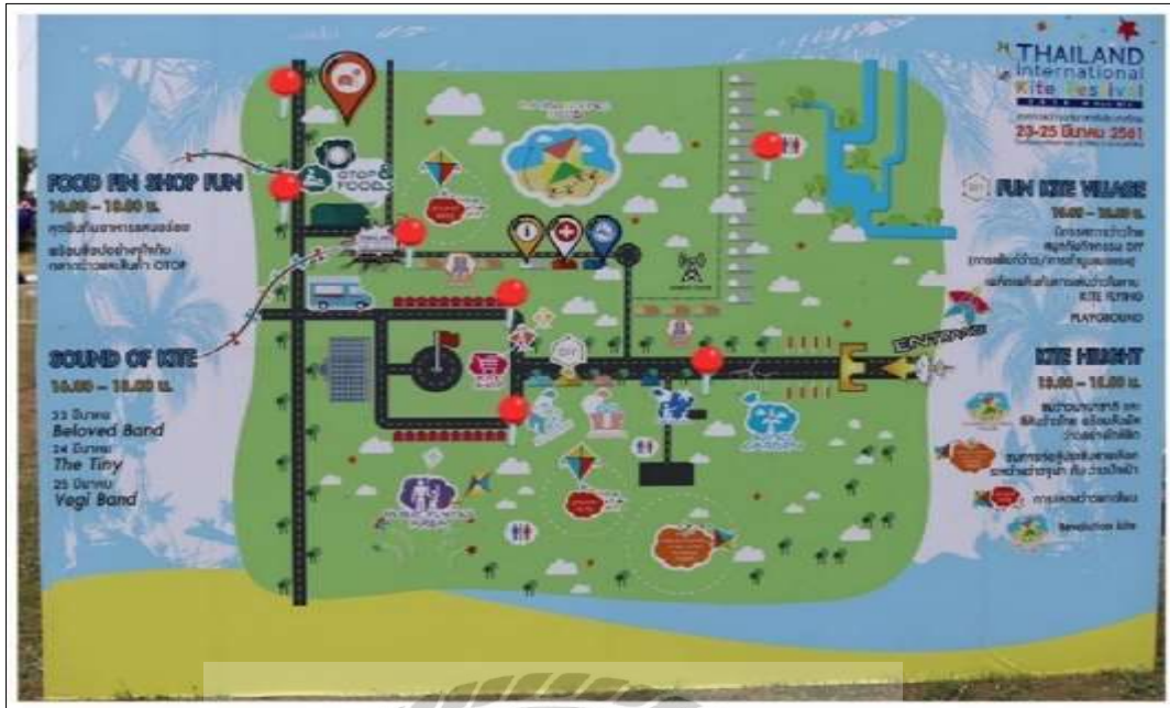
รูปที่ 4.4 จุดทั้งขยะ 7 จุดโดยรอบบริเวณพื้นที่การจัดงาน

ป้ายสื่อความหมายบริเวณถังขยะ เพื่อให้ผู้เข้าร่วม โครงการสามารถทิ้งขยะ ได้ถูกต้องตาม ประเภทของขยะ