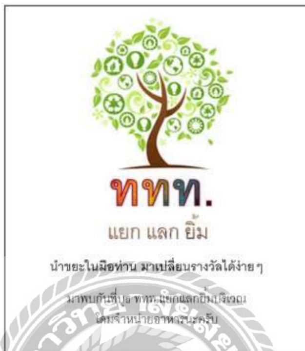
รูปที่ 4.14 ป้ายประชาสัมพันธ์โครงการ