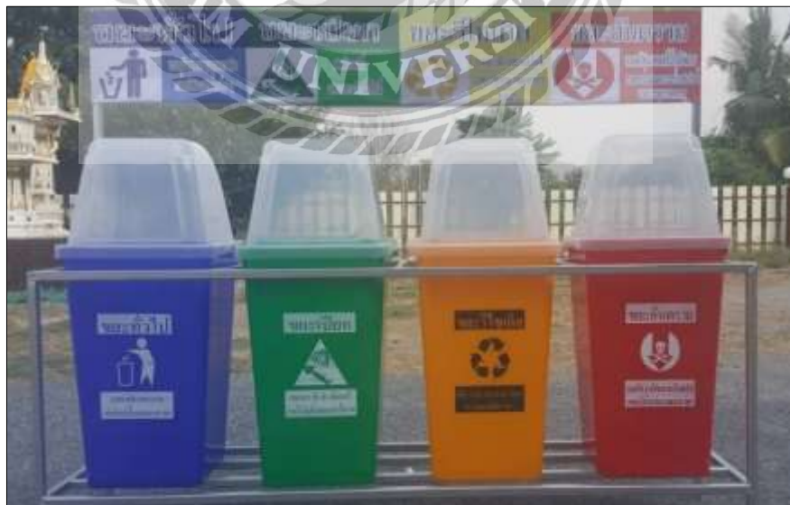
รูปที่ 4.5 ป้ายสื่อความหมายบริเวณถังขยะ

ป้ายสื่อความหมายบริเวณถังขยะ เพื่อให้ผู้เข้าร่วม โครงการสามารถทิ้งขยะ ได้ถูกต้องตาม ประเภทของขยะ