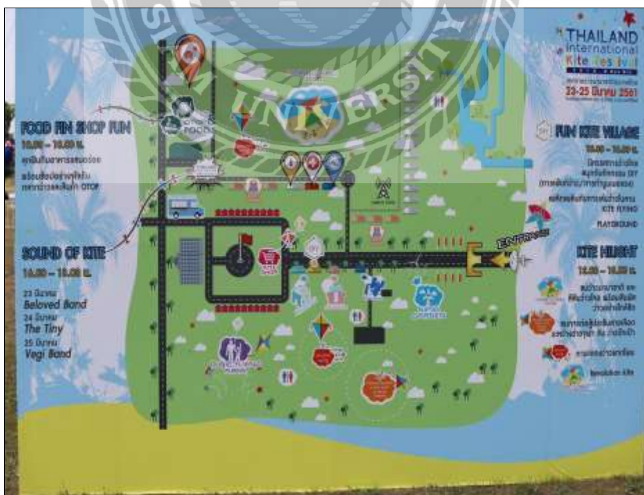
รูปที่ 4.2 แผนที่พื้นที่การจัดงาน

โรงเรียนนายสิบทหารบก อำเภอหัวหิน จังหวัดประจวบคีรีขันธ์