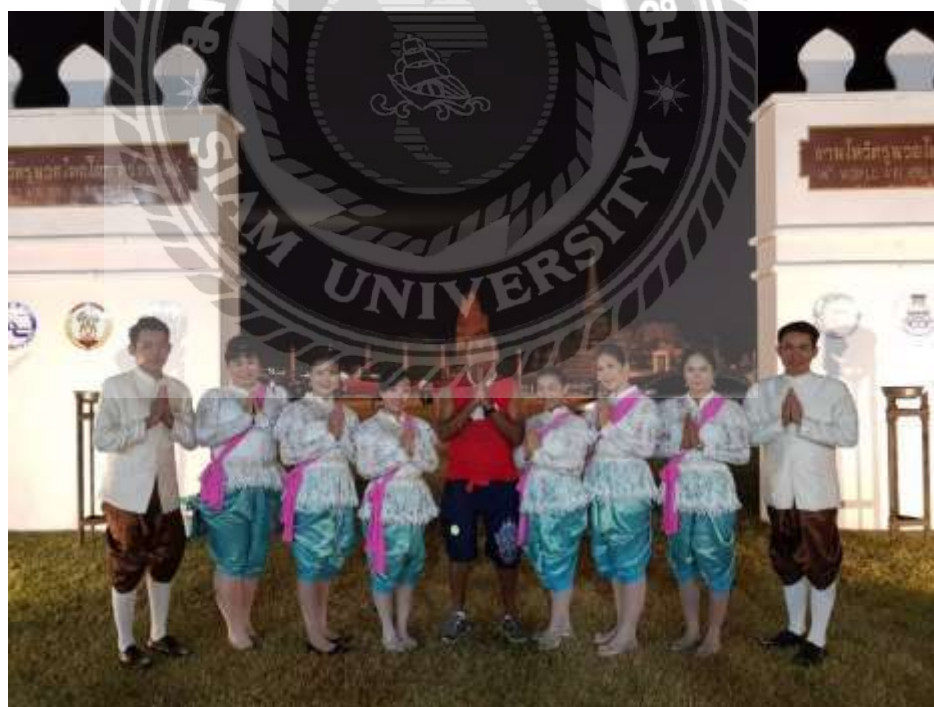
ภาพการปฏิบัติงานในการต้อนรับแขก VIP และดูแลฝั่งที่นั่งของแขก VIP ในการชมพิธีไหว้ครูมวย