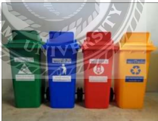
รูปที่ 4.3 ถังขยะขนาด 60 กิโลกรัม แบบแยกประเภท