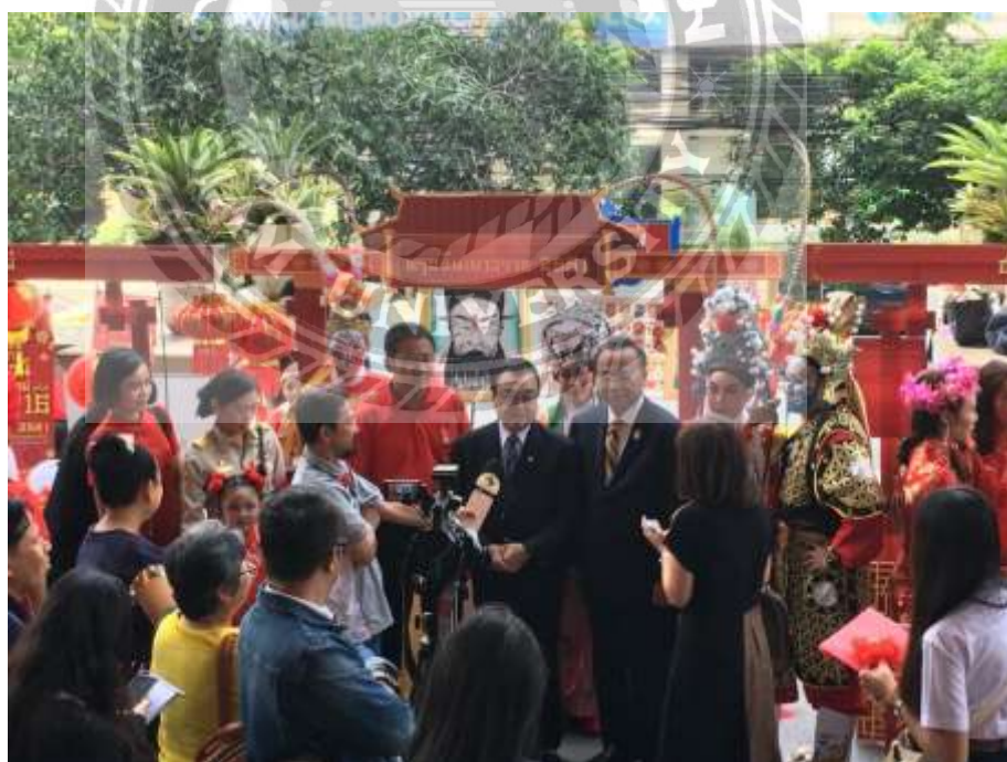
ภาพการปฏิบัติงานในการเก็บข้อมูลการฉลองข่าวเทศกาลตรุษจีนประเทศไทย 2561