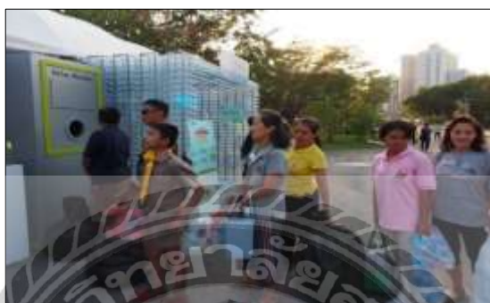
รูปที่ 4.9 กิจกรรมนำขยะมาแลกของรางวัล

ให้นักท่องเที่ยวนำขยะที่สามารถรีไซเคิลได้ อย่างเช่นขวดน้ำพลาสติกและกระป๋อง อลูมิเนียมจำนวน 5 ขวดหรือ 5 กระป๋องขึ้นไป นำมาแลกเป็นคูปองเพื่อนำไปจับรางวัลในตู้ลมจับรางวัล ดึงรับรางวัล กระเป๋าสีฟ้าททท.แยกแถกยี้ม หรือ ปากกาททท.แยกแถกยี้ม และผู้เข้าร่วมกิจกรรมต้องกดไลค์เฟซบุ๊ก เพจ Thailand Festival