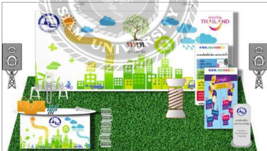
รูปที่ 4.7 ภาพรวมบูธ ททท. แยก แลก ยืม