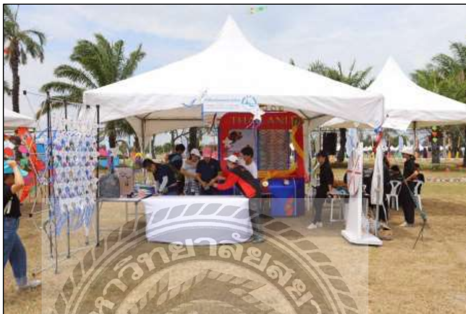
รูปที่ 4.11 บูธกิจกรรมของการท่องเที่ยวแห่งประเทศไทย

ให้นักท่องเที่ยวที่เข้าร่วมกิจกรรมในบูธกดไลค์และกดแชร์เฟสบุ๊ก เพจ Thailand Festival เพื่อรับของรางวัลสมุดโน้ตทำจากกระดาษรีไซเคิล