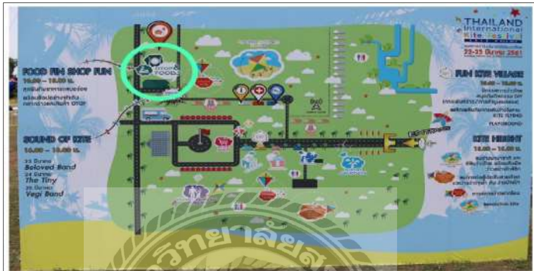
รูปที่ 4.6 จุดที่ตั้งบูธ ททท. แยกแลกยืม

บูธ ททท.แยกแลกยืม ตั้งอยู่บริเวณ โคมใหญ่ บริเวณที่จำหน่ายอาหารและเครื่องดื่ม ซึ่งเป็นบริเวณที่มีจำนวนมาก เหมาะแก่การตั้งบูธ