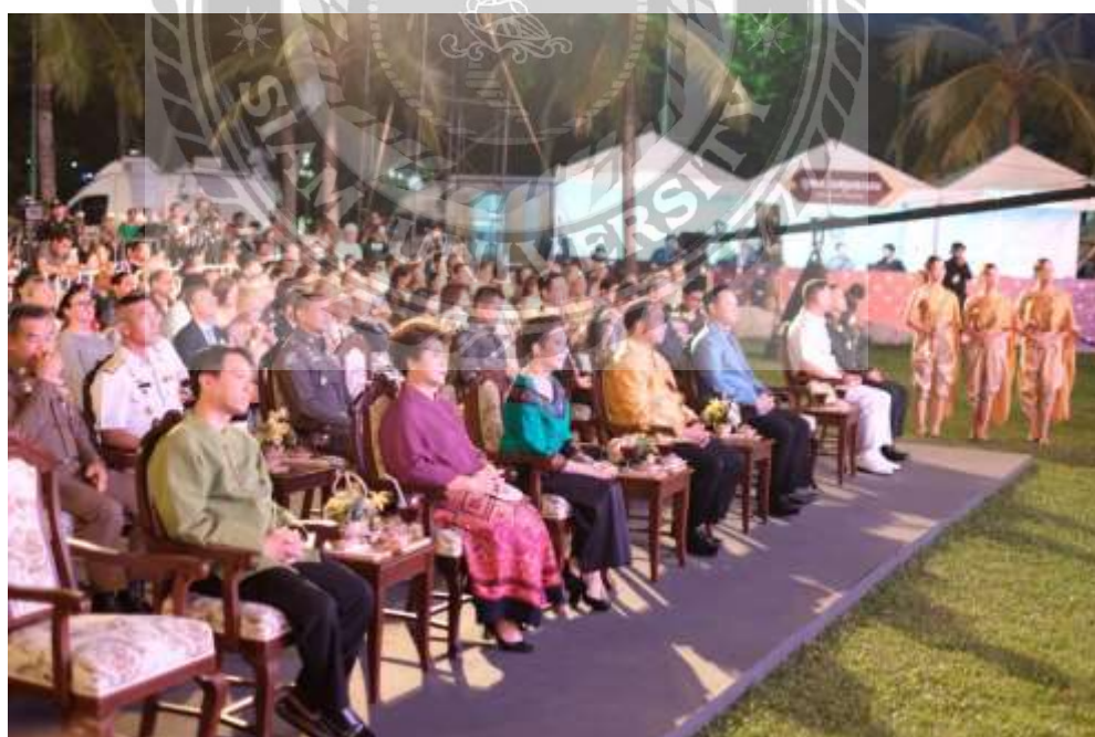
ภาพการปฏิบัติงานในการถ่ายภาพในงานเทศกาลเที่ยวเมืองไทย