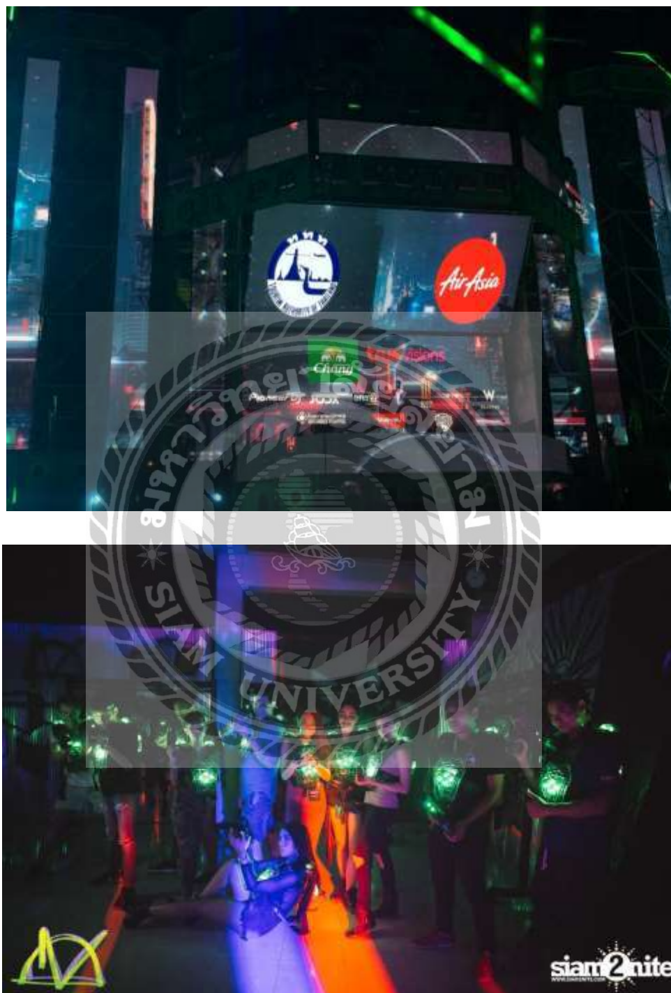
ภาพการปฏิบัติงานในงาน Dropzone Festival Bangkok 2018