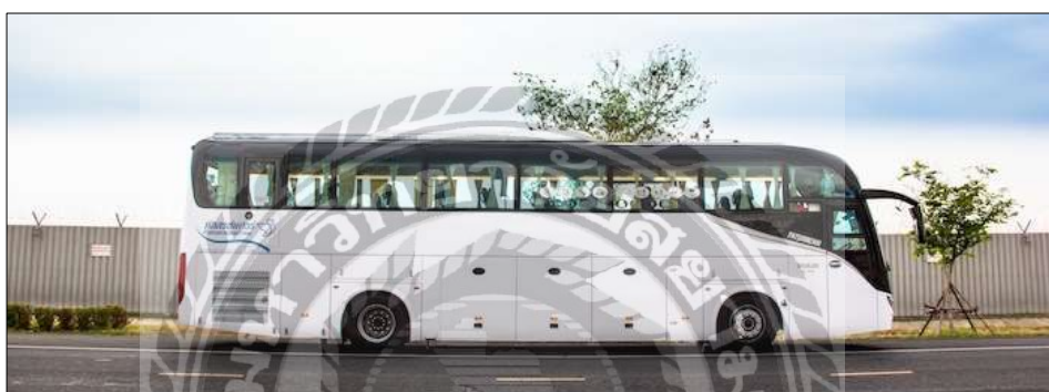
รูปที่ 4.8 รถบริการรับ-ส่ง

รถ Shuttle bus : สามารถขึ้นรถได้ที่ Market Village HuaHin โดยรถจะออกเดินทางทุกๆ ครึ่งชั่วโมง เริ่มต้นเวลา 11.00น. ถึง 18.00น.