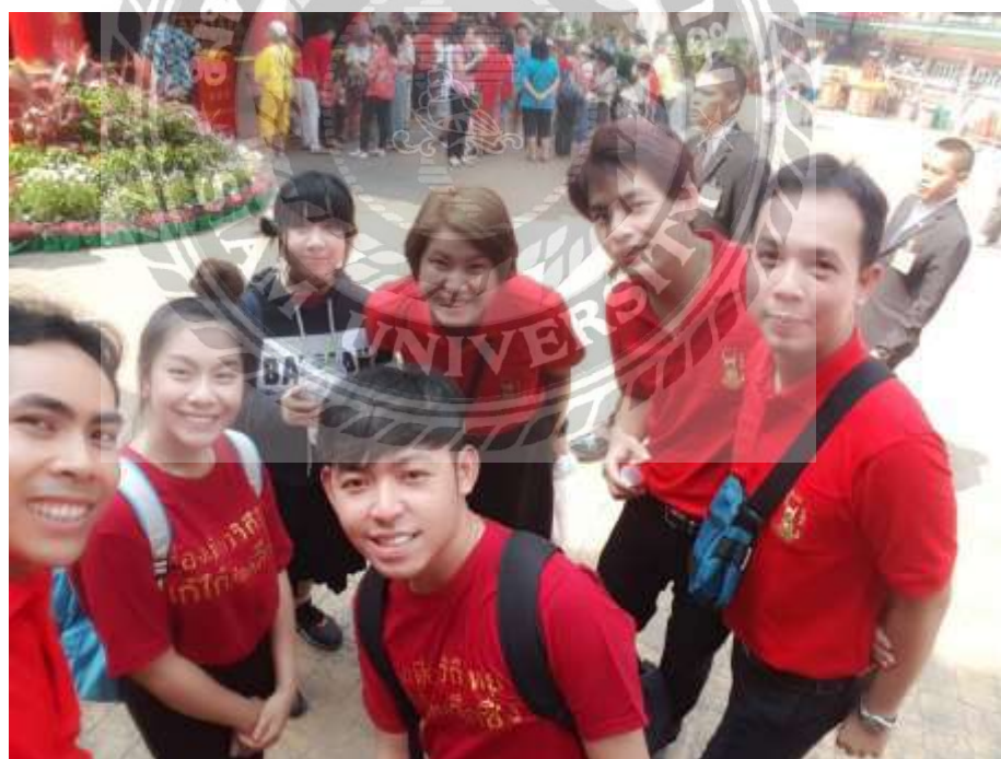
ภาพการเข้าเฝ้ารับเสด็จสมเด็จพระเทพรัตนราชสุดาฯ สยามบรมราชกุมารี

และภาพการปฏิบัติงานเทศกาลในบูธการท่องเที่ยวแห่งประเทศไทยในเทศกาลตรุษจีนเยาวราช 2561