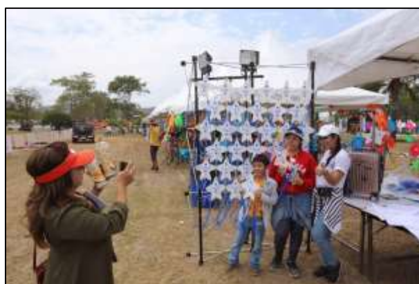
รูปที่ 4.10 พิธีกรในบูธกิจกรรมของการท่องเที่ยวแห่งประเทศไทย ที่มา : ภาพถ่ายจากงานเทศกาลว่านนานาชาติประเทศไทย 2561

มีพิธีกรให้ความรู้เกี่ยวกับความสำคัญของการแยกขยะและความรู้เกี่ยวกับ CSR กิจกรรมได้ตระหนักถึงความสำคัญการแยกขยะ มีการเล่นเกมสตอบคำถามเพื่อดึงรับรางวัลกระเป๋าสีฟ้าททท.แยกแถกยี้มหรือ ปากกาททท.แยกแถกยี้ม มีบทพิธีกรและบทบรรยาย (เอกสารอยู่ในภาคผนวก)