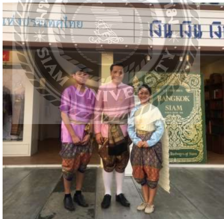
ภาพการปฏิบัติงานในการต้อนรับนายกรัฐมนตรีและรัฐมนตรีว่าการกระทรวงการท่องเที่ยวและกีฬา