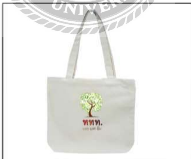
รูปที่ 4.15 กระเป๋าผ้าททท. แยก แลก ยืม