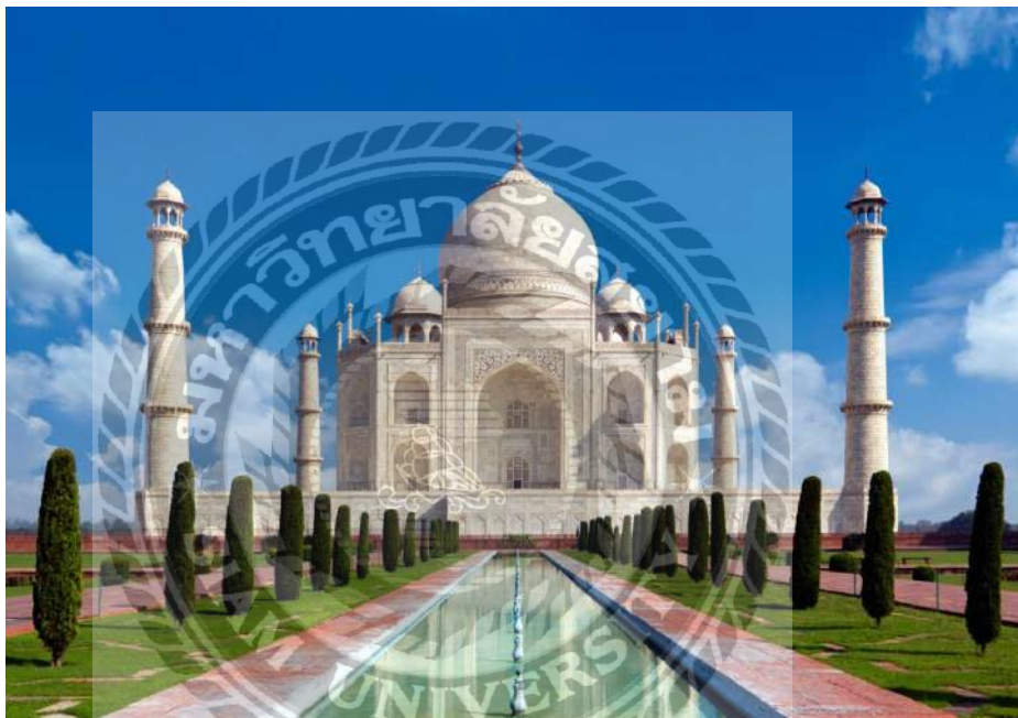
รูปที่ 2.1 กรุงนิวเดลี ประเทศอินเดีย