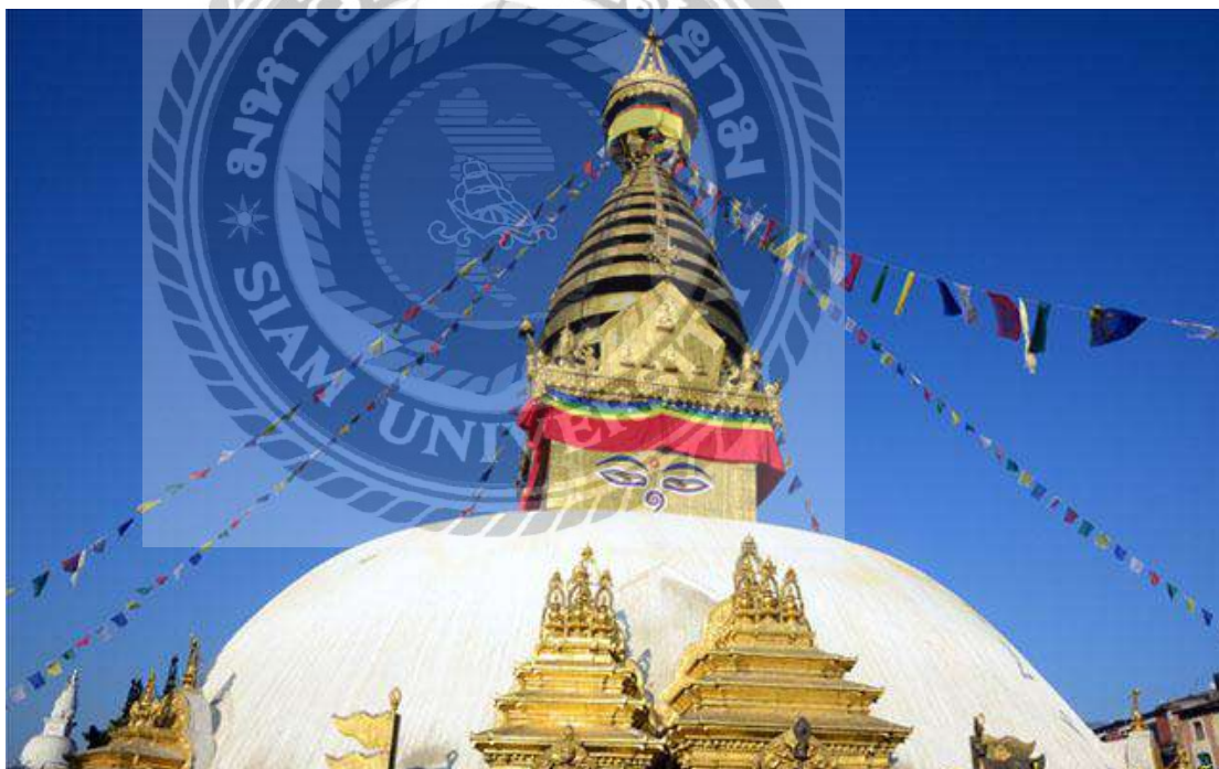
รูปที่ 2.2 เจดีย์โพธินาถ ประเทศเนปาล