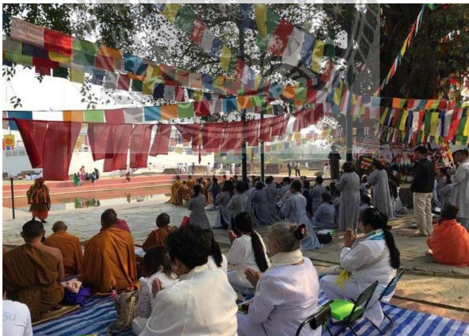
ภาพลุมพินี สถานที่ประสูติ (เนปาล)