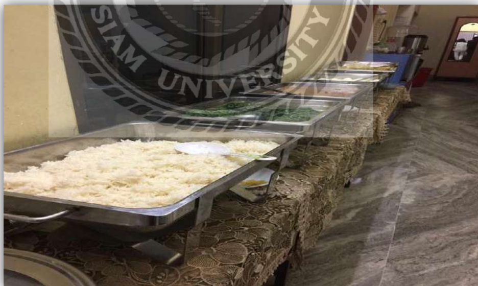
รูปที่ 4.6 การบริการอาหารและโภชนาการสำหรับผู้สูงอายุเพื่อสุขภาพ ที่มา: บริษัทธรรมहरษาทัวร์ แอนด์ แทรเวล จำกัด