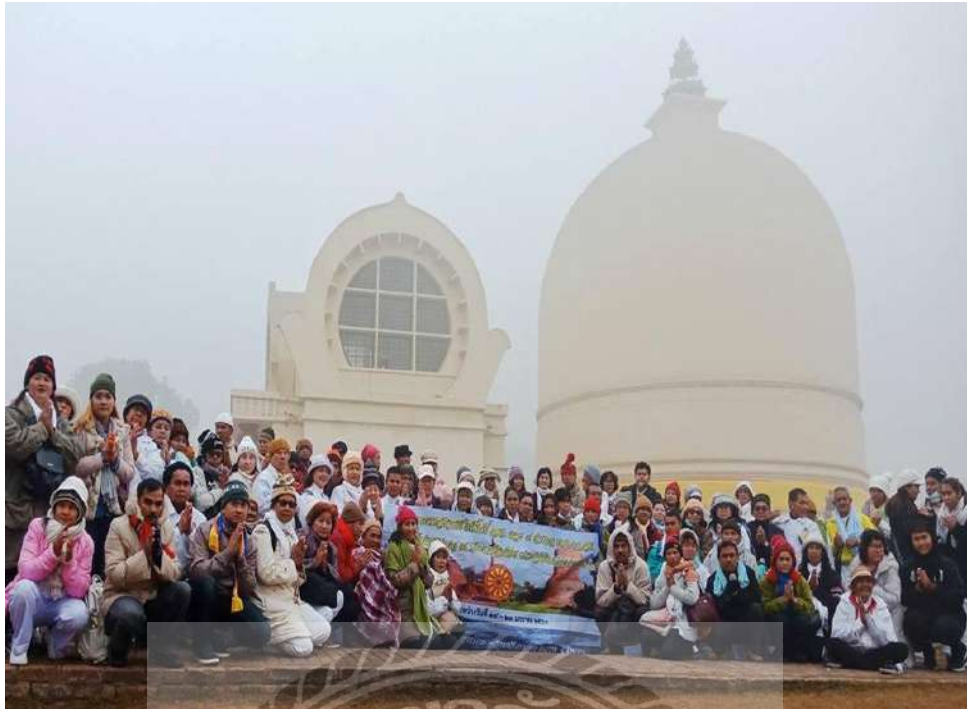
ภาพปรินิพพานสถูป สถานที่ปรินิพพาน กุสินารา (อินเดีย)