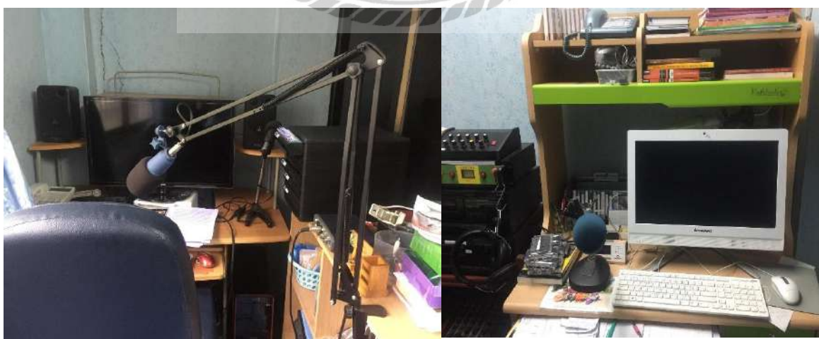
รูปที่ 4.1 ที่จัดรายการวิทยุ

- ช่อง 8 ที่วิพุดได้ www.thaitv8.com จำนวน PSI 276 ฯลฯ เคเบิลทีวี ทุกวันอังคาร เวลา 19.00-20.00 น.