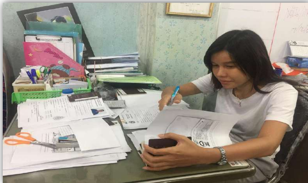
รูปที่ 4.3 กรอกข้อมูลวีซ่า เนปาล