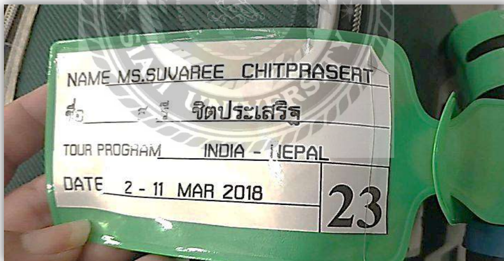
รูปที่ 4.4 แท็กติดกระเป๋า ที่มา: บริษัทธรรมहरณาทัวร์ แอนด์ แทรเวล จำกัด