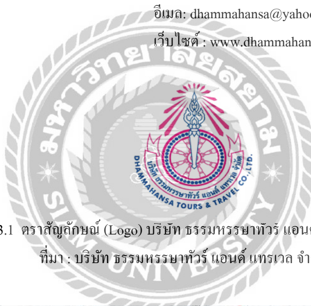
รูปที่ 3.1 ตราสัญลักษณ์ (Logo) บริษัท ธรรมหรรษาทัวร์ แอนด์ แทรเวล จำกัด