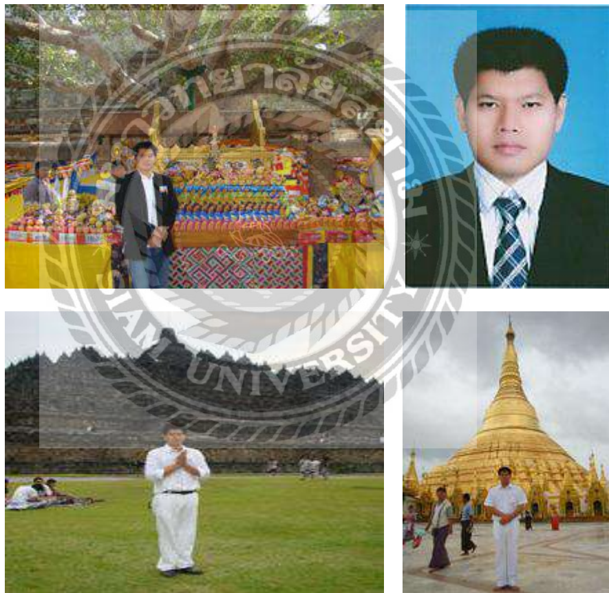
รูปที่ 3.3 ประธานกรรมการบริหาร / ผู้อำนวยการศูนย์ปฏิบัติธรรมนานาชาติชรรณหรรษา