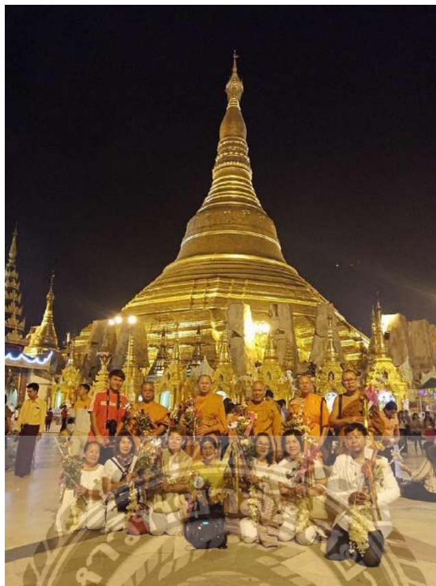
ภาพเจดีย์ชเวดากอง(พม่า) ที่มา: บริษัทธรรมहरษาทัวร์ แอนด์ แพรวเวด จำกัด