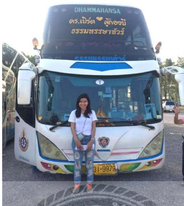
ภาพออกทัวร์ในประเทศโปรแกรมปิดทองฝังลูกนิมิต ที่มา: บริษัทธรรมहरษาทัวร์ แอนด์ แทรเวล จำกัด