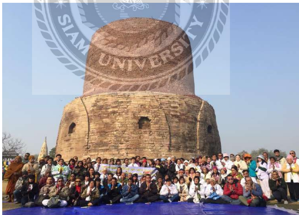
ภาพอิติปตนมฤคทายวัน สารนาถ (อินเดีย)