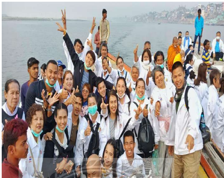
ภาพล่องเรือชมอารยธรรมสองฝั่งแม่น้ำคงคา (อินเดีย)