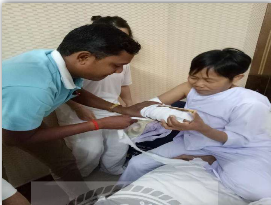
รูปที่ 4.7 การปฐมพยาบาลเบื้องต้น ที่มา: บริษัทธรรมहरษาทัวร์ แอนด์ แทรเวล จำกัด

การประชาสัมพันธ์โปรแกรมเนปาล อินเดีย ผ่านสื่อวิทยุ เราสามารถเลือกกลุ่มผู้ฟังได้ มีความรวดเร็วในการส่งข่าวสาร สามารถส่งข่าวสารไปยังผู้ฟังได้จำนวนมาก เข้าถึงกลุ่มเป้าหมายได้ง่ายโดยเฉพาะกลุ่ม Gen B เป็นการเพิ่มแรงจูงใจ ทำให้นักท่องเที่ยวในกลุ่ม Gen B เกิดความประทับใจในการใช้บริการการท่องเที่ยวกับ บริษัท ธรรมहरษาทัวร์ แอนด์ แทรเวล จำกัด เพื่อเป็นการต่อ ยอดให้นักท่องเที่ยวมีการใช้บริการซ้ำอย่างต่อเนื่องสร้างภาพลักษณ์ที่ดีให้แก่บริษัท