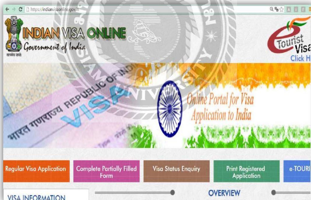
รูปที่ 4.2 โปรแกรมกรอกเอกสารในระบบ https://indianvisaonline.gov.in/

ประเทศอินเดียจะต้องมีการทำวีซ่าเข้าประเทศ โดยทางบริษัทจะมีการกรอกข้อมูลการทำวีซ่าให้แก่ลูกค้า โดยจะขอพาสปอร์ตตัวจริง รูปพื้นหลังขาว ขนาด 2x2 จำนวน 3 ใบ สำเนาบัตรประชาชน สำเนาทะเบียนบ้าน เบอร์โทรศัพท์ที่สามารถติดต่อได้ การไปประเทศอินเดียจะต้องทำเอกสารยื่นวีซ่า โดยต้องกรอกเอกสารในระบบ https://indianvisaonline.gov.in/