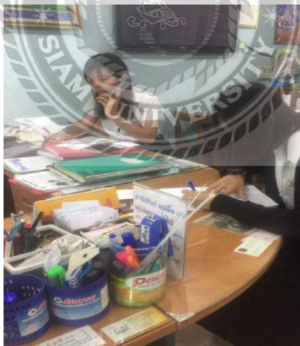
ภาพให้ข้อมูลโปรแกรมทัวร์กับลูกค้าทางโทรศัพท์