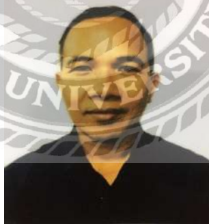
รูปที่ 3.6 พนักงานที่ปรึกษา

3.5.2 ตำแหน่งงานของพนักงานที่ปรึกษา ผู้จัดการทัวร์