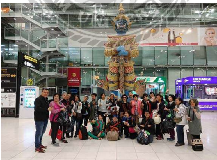
ภาพไปส่งลูกค้าออกทัวร์ที่สนามบิน ที่มา: บริษัทธรรมहरษาทัวร์ แอนด์ แทรเวล จำกัด