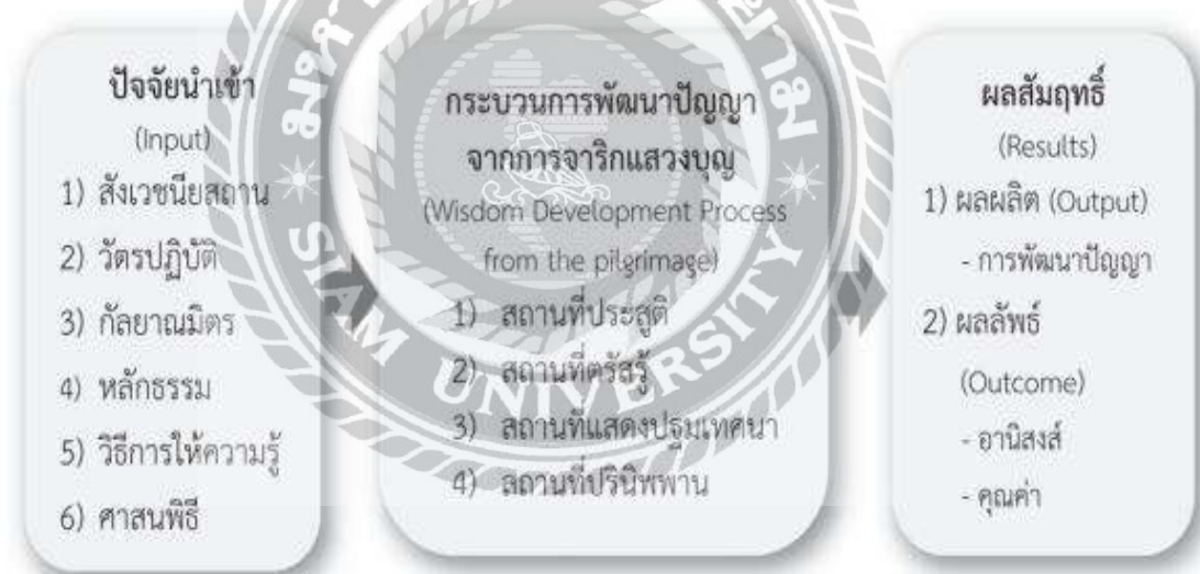
รูปที่ 2.3 กระบวนการพัฒนาปัญญา

2.3.3 กระบวนการพัฒนาปัญญาจากการจาริกแสวงบุญ ณ สังฆนียสถาน 4 ผลการวิจัยพบว่า กระบวนการพัฒนาปัญญาจากการจาริกแสวงบุญ ณ สังฆนียสถาน 4 ประกอบด้วยปัจจัยนำเข้า (Input) 6 ประการ คือ 1. สังฆนียสถาน 2. วัตรปฏิบัติ 3. กัลยาณมิตร 4. หลักธรรม 5. วิธีการให้ความรู้ 6. ศาสนพิธี ส่วนกระบวนการพัฒนาปัญญาจากการจาริกแสวงบุญแต่ละ แห่งมีความแตกต่างกันตามแต่สังฆนียสถาน วัตรปฏิบัติและหลักธรรมที่ได้จากพุทธประวัติ ส่วนผลสัมฤทธิ์ (Results) จากกระบวนการพัฒนาปัญญา คือ ผู้จาริกแสวงบุญได้รับการพัฒนาปัญญาและการพัฒนาปัญญา นี้มีทั้งอันิสงส์และคุณค่าอย่างยั่งยืน