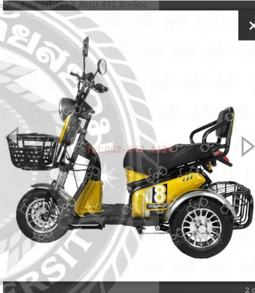
ภาพที่ 4.10 รูปสินค้ารถจักรยานไฟฟ้าเพื่อ Di-Cut รูปทั้งมุมมองและด้าน