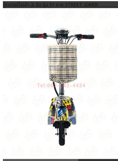
ภาพที่ 4.12 รูปสินค้ารถจักรยานไฟฟ้าเพื่อ Di-Cut รูปทั้งมุมและด้าน