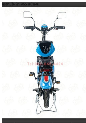
ภาพที่ 4.8 รูปสินค้ารถจักรยานไฟฟ้าเพื่อ Di-Cut รูปทั้งมุมมองและด้าน