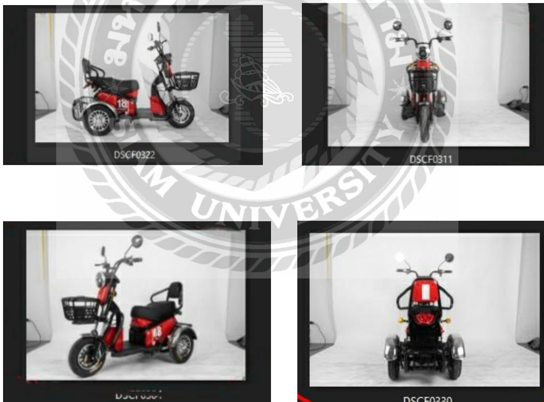
ภาพที่ 4.1 รูปภาพสินค้ารถจักรยานไฟฟ้าถ่ายทั้งมุมและด้าน

(Di-Cut) ภาพพื้นหลัง 3-5 รูป การทำ (Di-Cut) ภาพพื้นหลังแต่ละมุมแต่ละด้านโดยใช้โปรแกรม Adobe Photoshop หลังจาก (Di-cut) ภาพพื้นหลังแต่ละรูปเสร็จก็ส่งให้ฝ่ายโปรดักชั่นทำต่อไป