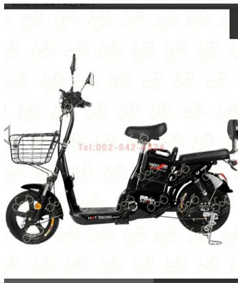
ภาพที่ 4.3 รูปสินค้ารถจักรยานไฟฟ้าเพื่อ Di-Cut รูปทั้งมุมมองและด้าน