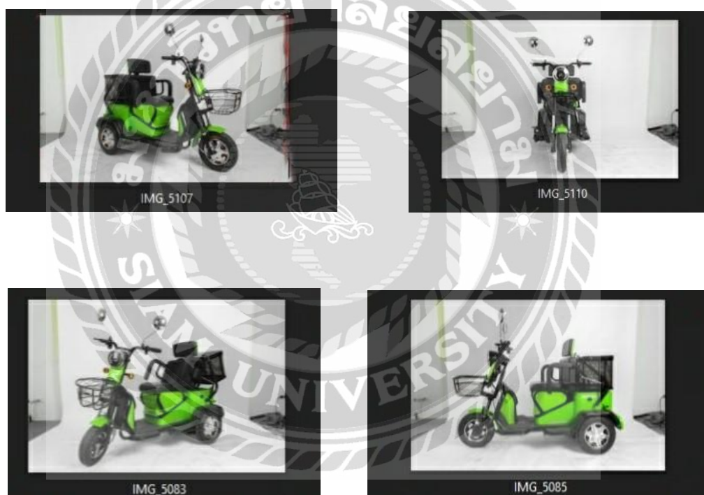
ภาพที่ 4.5 รูปสินค้ารถจักรยานไฟฟ้าเพื่อ Di-Cut รูปทั้งมุมและด้าน

Retouch ภาพสินค้าทั้งหมด การทำ Di-Cut ภาพพื้นหลังแต่ละมุมแต่ละด้าน โดยใช้โปรแกรม Adobe Photoshop หลังจาก Di-cut ภาพพื้นหลังทั้งหมดก็เซฟรูปเป็น PNG และตั้งชื่อไฟล์ Retouch เสร็จก็ส่งให้ฝ่ายโปรดักชันทำต่อไป