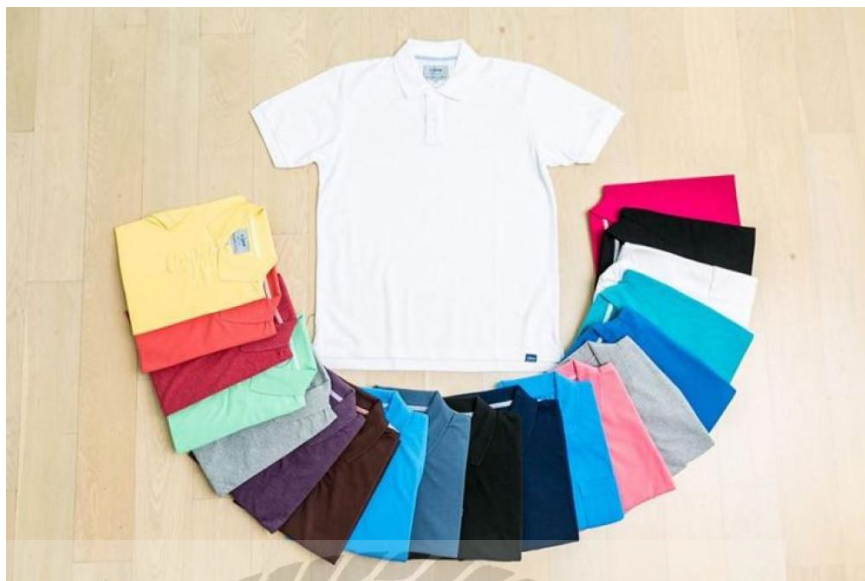
รูปที่ 3.3 ตัวอย่างผลิตภัณฑ์เสื้อผ้า เทีพพ์