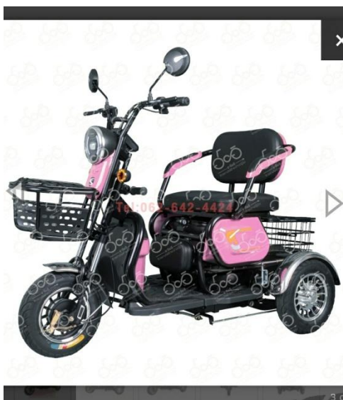
ระบบไฟฟ้า ลมรอบ 492 ลิทลอง