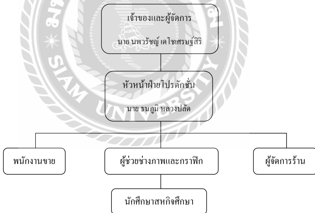
ตารางที่ 3.4 แผนภูมิการจัดองค์กรและการบริหารของ บริษัท เทีพพ์ กรุ๊ป