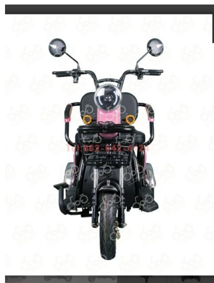
ระบบไฟฟ้า ลมรอบ 492 ลิทลอง