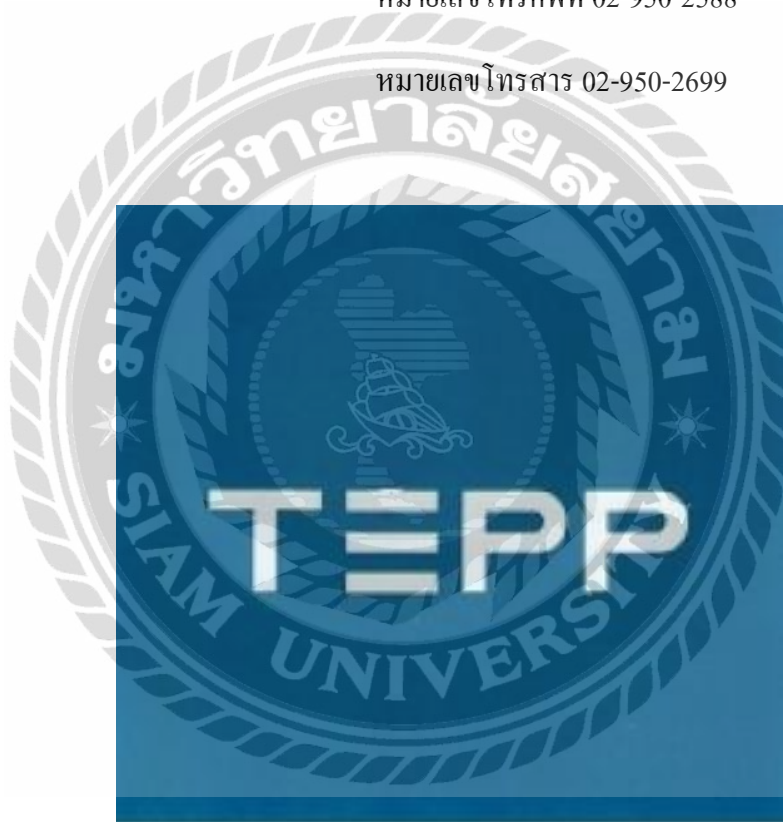
รูปที่ 3.1 ตราสัญลักษณ์ (Logo) บริษัท เท็พพ์ กรุ๊ป