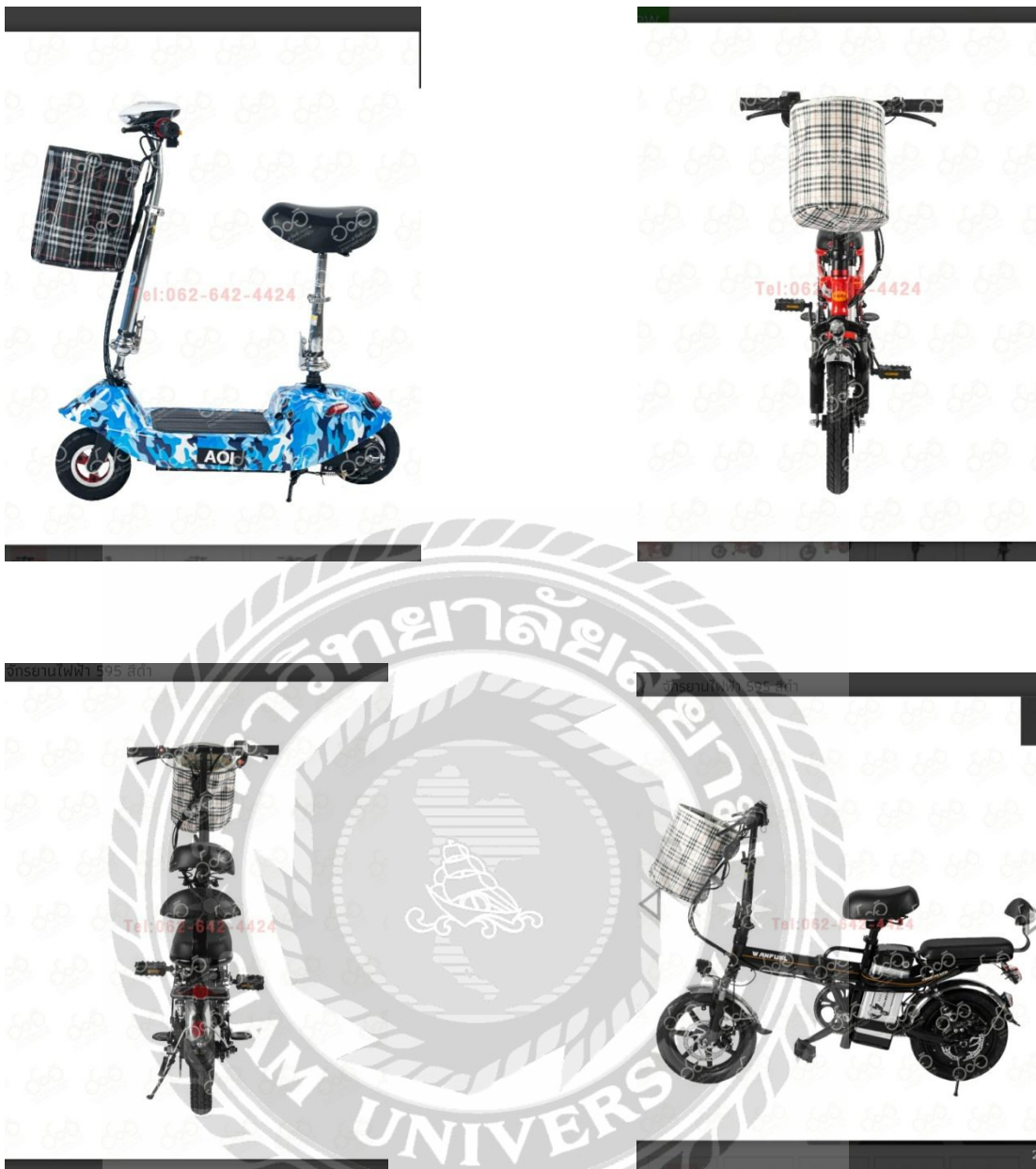
ภาพที่ 4.6 รูปสินค้ารถจักรยานไฟฟ้าในไฟล์ชุดแรก