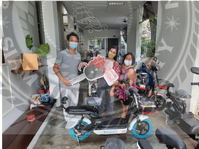
ภาพขณะที่ผู้จัดทำกำลังถ่ายรูปที่ระลึกลูกค้าได้รับรถจักรยานไฟฟ้า