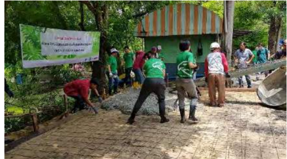
รูปที่ 2 แสดงกิจกรรมคอนกรีตผสมใบจากในภาคสนาม