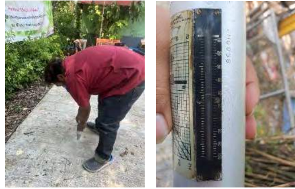
รูปที่ 7 แสดงการทดสอบค่ากำลังอัดแบบไม่ทำลายในภาคสนาม