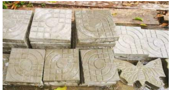
รูปที่ 3 แสดงแผ่นพื้นซีเมนต์ผสมใบจาก