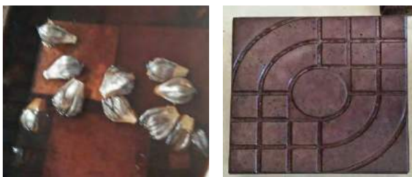
รูปที่ 5 แสดงการย้อมสีแผ่นพื้นซีเมนต์ผสมใบจากด้วยลูกจาก

ผลการทดสอบค่ากำลังแรงอัดในพื้นที่สนามด้วยการวัดค่าการสะท้อนด้วย SCHMIDT HAMMER โดยค้อนกระแทกแบบชนิดที่ (SCHMIDT HAMMER) เป็นเครื่องมือทดสอบคอนกรีตแบบไม่ทำลาย