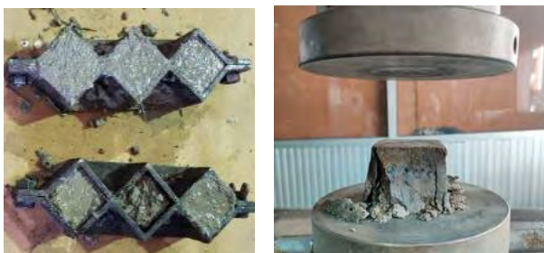
รูปที่ 6 แสดงผลการทดสอบค่ากำลังอัดมอร์ต้าซีเมนต์ผสมใบจาก