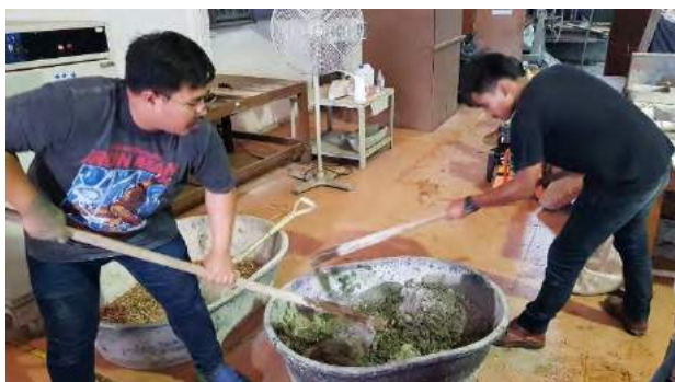
รูปที่ 1 แสดงการทดลองผสมซีเมนต์ผสมใบจาก