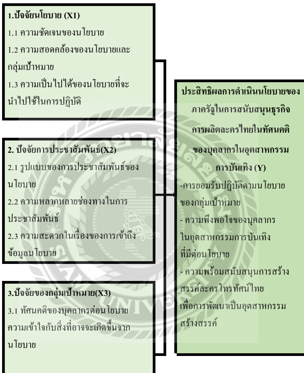
ภาพที่ 4 กรอบแนวคิดการวิจัย