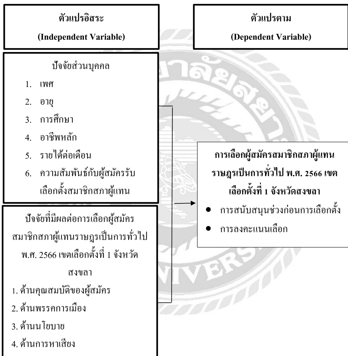
ภาพที่ 2.1 กรอบการวิจัย

จากการทบทวนแนวคิด ทฤษฎีที่เกี่ยวข้อง รวมถึงทบทวนวรรณกรรมในส่วนงานศึกษาก่อนหน้าตามที่อธิบายไปข้างต้น ทำให้นำมาสู่การสร้างกรอบแนวคิดในการวิจัยเรื่อง ปัจจัยที่มีผลต่อการเลือกผู้สมัครสมาชิกสภาผู้แทนราษฎรเป็นการทั่วไป พ.ศ. 2566 เขตเลือกตั้งที่ 1 จังหวัดสงขลา ได้ ดังนี้